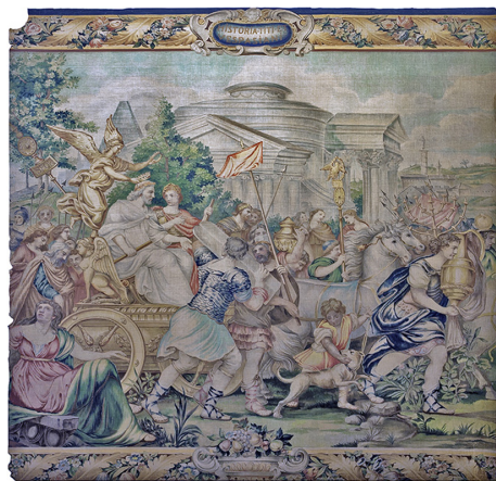
„Intrarea triumfală în Roma a împăratului Vespasian și a lui Titus”, Colecția „Textile”

N.D.I.: Da, este foarte bogată și valoroasă, fiind alcătuită din peste 4.000 de piese: covoare, tapiserii, draperii, broderii, creații ale atelierelor europene și orientale din perioada secolelor XVI-XX. Constituită