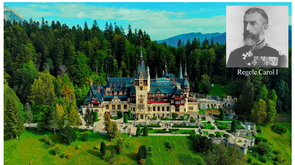
Regele Carol I

în principal din piese achiziționate sau primite de membrii Casei Regale a României, colecția de textile cuprinde și două piese cu valoare excepțională, a căror simbolistică este legată intrinsec de încoronarea regelui Ferdinand I și a reginei Maria de la Alba Iulia, în 15 octombrie 1922: mantiile regale, realizate în ateliere de la Paris și București, după proiectul pictorului Costin Petrescu. După anul 1948, multe dintre textilele de valoare ale Peleșului au fost transferate către alte muzee și instituții din Țară, unele pierzându-se pentru totdeauna.