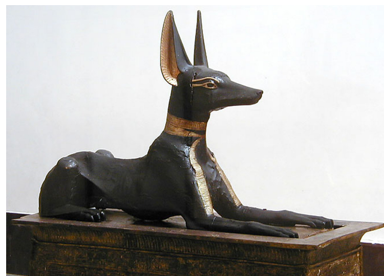
Anubis așezat, mormântul lui Tutankhamon

O altă frumoasă legendă spune despre Țâncul pământului, care apare în prim-plan: „Se zice că Dumnezeu, când a urzit lumea, a urzit prea multe și că acestea nu încăpeau sub cer. Ce să facă? Ce să dreagă? Ca să afle, trimite albina să ispitească pe Țâncul pământului. Albina a mers la Țâncul pământului, dar acesta n'a voit să-i spuie: - Dacă-i Dumnezeu, lasă că știe singur ce să facă! Albina, cuminte, nu s'a dus, ci s'a ascuns lângă poarta lui. Țâncul pământului, crezând că-i singur, a zis: - Hm! El mă întreabă pe mine ce să facă. Da de ce nu strânge pământul în mână, că s'ar face ici dealuri, colo văi, și atunci toate ar încăpea pe lume. Albina cum a auzit, a zburat la Dumnezeu și i-a spus ce a auzit. Dumnezeu, pentru