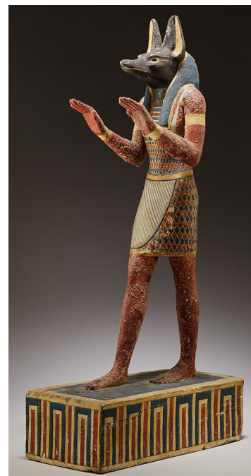
Anubis – Zeul egiptean cu cap de câine negru (Șacal)

lucru fiind însă incert. Există de asemenea și varianta în care Nephthys l-a dat în creștere lui Isis pe Anubis pentru ca Seth să nu afle de relația extraconjugală pe care a avut-o cu Osiris. Anubis avea o fiică numită Kebechet, descrisă ca fiind un șarpe. Aceasta era considerată zeița purificării și a prospețimii. Kebechet îl ajuta pe