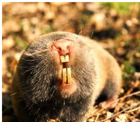
Țâncul pământului – Sobolul cârtiță

O frumoasă legendă, care circula în vechiul Regat, încerca să deslușească motivul retragerii în subteran a acestei vietăți. Astfel, se spune că, la început, orbetele era un câine care păzea curtea unui