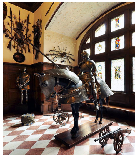
Armură equestre de turnir (tip Maximilian) Colecția „Arme și Armuri”

N.D.I.: Ceramica europeană (spaniolă, olandeză sau britanică) și faianța italiană sau cea istorică franceză constituie - alături de porțelanurile atât de dragi cititorului Castelului Peleş, realizate în ateliere celebre din Germania, Austria sau Boemia - nucleul colecției regelui Carol I al României, care