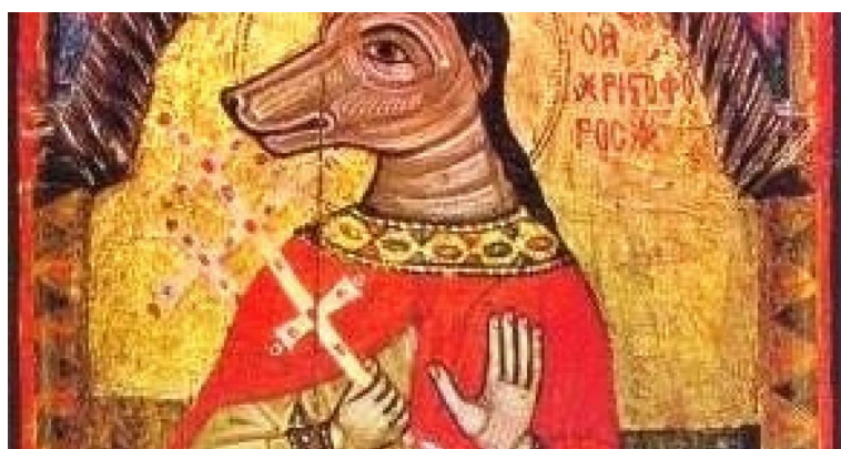
Sfântul Hristofor – Sfântul cu cap de câine

O lumină ciudată s-a văzut la orizont și un hăuit sinistru a însoțit-o. Era 4 martie 1977. Poate era rezultatul fricțiunii plăcilor tectonice puse în mișcare, sau erau „câinii pământului” care ne prevesteau grozăvia ce avea să se întâmple. Între creaturile supranaturale imaginate de poporul român, „Cățelul pământului” ocupă un loc aparte. De ce aparte? Pentru că, spre deosebire de ursitoare, zâne, iele, stafii, strigoi sau joimărițe – ca să numesc doar câțiva dintre acești prieteni sau dușmani imaginari ai românului – Cățelul pământului (numit și „Câinele pământului”, „Grivan” sau „Țâncul pământului”) are un corespondent în lumea reală. Acest corespondent este un rozător care se hrănește cu rădăcini și care trăiește în tainica lume subpământeană, ascuns de ochii oamenilor: „orbetele”.