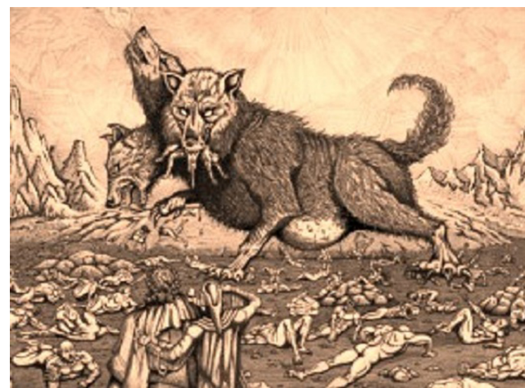
Cerberul cu trei capete - Cățelul pământului

Anubis este denumirea în greaca clasică a zeului egiptean cu cap de șacal (sau câine) asociat mumificării și vieții de apoi. În limba