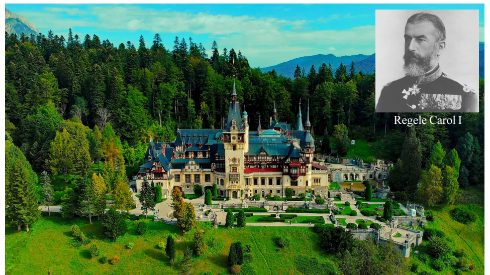
Regele Carol I