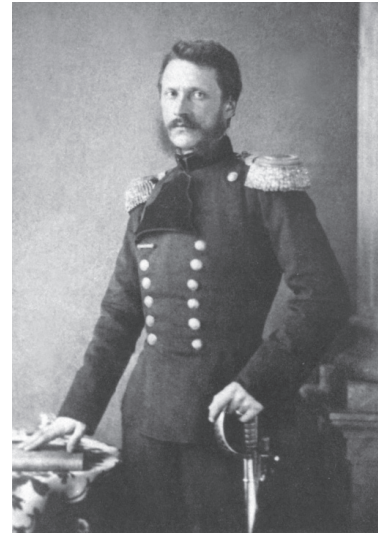
Alexandru Ioan Cuza

S-a întors în țară. (...) Cunoștea puțină lume, doar cercul de tineri între care trăise, eleganta lume femeiască din Iași. Pe cei de jos i-a descoperit după ce a luat Domnia; atunci întâi, potrivit cu datoria lui, a recunoscut el cu