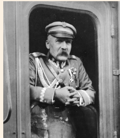
Conducătorul de Stat al Poloniei a sosit la Sinaia, 14.09.1922

Regina Maria a României, Însemnări zilnice, București, vol IV, p.277-279