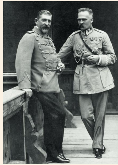
Regele Ferdinand al României și Mareșalul Poloniei, Józef Piłsudski