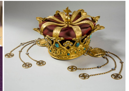
Coroana Reginei Maria a României