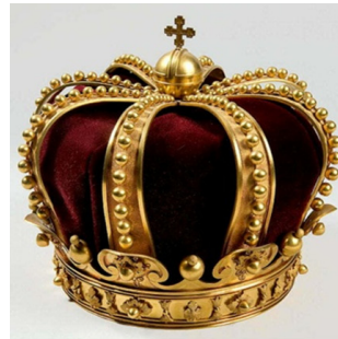
Coroana Reginei Elisabeta a României (1881)