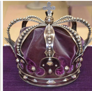
Coroana de oțel a Regilor României