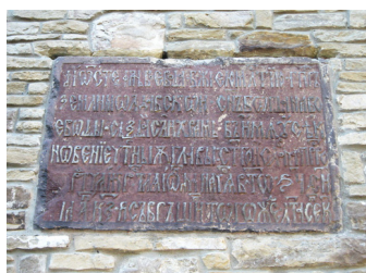
Pisania pusă de Ștefan cel Mare