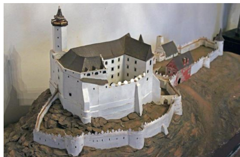
Macheta castelului lui Mihai Viteazul din Silezia

Fiindu-i recunoscute meritele de erou al Imperiului și al Creștinătății, lui Mihai Viteazul, principele Valahiei, îi este dăruit un castel de către împăratul Sfântului Imperiu Roman, Rudolf al II-lea. La începutul anului 1601, Mihai Viteazul a devenit stăpânitorul ereditar al castelului Kynsburg ( Kynsburg, Kinspurg, Künigsberg , denumit astăzi Zamek Grodno ), una dintre cele mai pitorești reședințe fortificate din Silezia Superioară (Polonia), o regiune care nu duce lipsă de castele. Situat la 450 de metri deasupra văii Bystrica, în localitatea Zagórze Śląskie, înconjurat de o pădure de pini, cu o suprafață de peste 19 hectare. Prima atestare documentară a castelului datează din anul 1315, când era o fortificație de graniță, ridicată la hotarul Sileziei cu Boemia. În timpul domniei lui Carol al IV-lea de Luxemburg, Silezia trece, odată cu castelul, în stăpânirea Coroanei Boemiei și a Sfântului Imperiu, iar castelul își pierde vechiul rol de