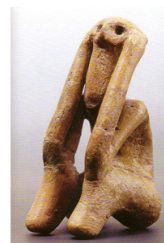
Gânditorul de la Târpești