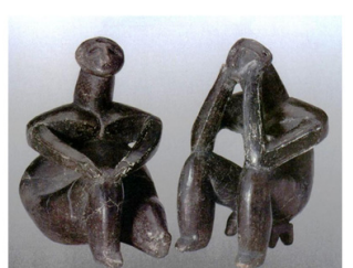
Gânditorul de la Hamangia și Femeia sa