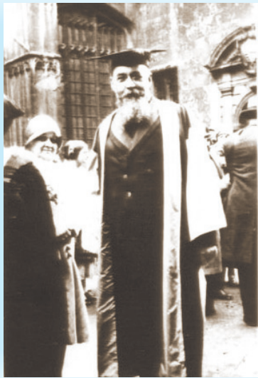
Nicolae Iorga - Doctor Honoris Causa al Universității din Oxford

1930. Conferințe la Sorbona, Société d'Histoire moderne, l'École des langues orientales, Faculté de Théologie Protestante. Merge apoi la Geneva, iar de aici la New-York. Vizitează orașele Columbia, Washington, Chicago, Indiana, Harbour, Aurora, Cleveland, Youngston, Champbell, Akron, Fanen, Pittsburgh, Canton, Detroit, San Francisco, Los Angeles, San Diego, Gettysburgh, Boston, ținând și conferințe în localitățile respective. Pretutindeni a căutat să intre în legătură cu comunitățile românești. Se reîntoarce prin Italia, conferențind la Torino și Veneția. În aprilie pleacă la Londra, pentru a participa la Congresul de istorie. La Oxford i se conferă titlul de Doctor Honoris Causa , cu un discurs introductiv despre Titus Livius și Plinius cel Bătrân.