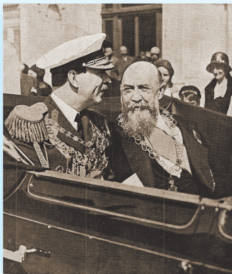
Regele Carol al II-lea și președintele Consiliului de Miniștri, Nicolae Iorga, în vizită la Timișoara (mai 1931)

I se conferă în cursul anului ordine și distincții: Ferdinand, Doctor Honoris Causa al Universității din Vilnius, Doctor Honoris Causa al Universității din Paris etc.