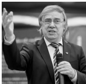
15 iulie 1948 – 12 martie 2021

mă spăl pe mâini numai de propriile mele mâini și mă las legat de boarea de zăpadă a poporului meu. Mărul se poate spăla numai de măr, de pomul mărului nu! De pom nu! Apără, Doamne, poporul român și nu te spăla de el! Pe maica mea care m-a născut pe mine am dăruit-o poporului român. Dăruiește-ți, Doamne, pe maica Ta, care te-a născut pe Tine, poporului român!