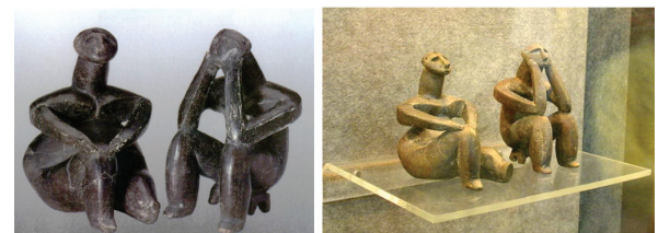
Gânditorul de la Hamangia și Femeia sa

De cele mai multe ori, statuetele reprezentau zeiță și erau așezate pe mici altare casnice. Zeița Mamă era cea care ocupa primul loc în acea perioadă. Și totuși, iată că și personajele masculine își aveau locul și rostul lor în panteon, iar existența acestor „gânditori” ne pune pe gânduri. Această atitudine ne face să avem o trimitere către starea meditativă necesară spre a putea „chema” vibrația gândului bun, a ideii de a ieși dintr-un impas, a necesității unui moment de liniște în care să se „adune” gândurile, ca un aparat de radio ce prinde „unda” postului selectat și gândul (ideea) vine acolo unde găsește vibrația cerebrală necesară. Dacă nu ești concentrat pe cele ce te interesează, dacă nu ai un scop, un țel, nici vibrația divină nu concordă cu tine. Oricum, la aceste statuete preistorice este vorba și de o îngrijorare, o așteptare necesară. Viața în materie nu este una tocmai fericită, având în vedere condițiile de trai din acea epocă. O întregă filozofie putem „citi” pe chipul impenetrabil al statuetelor. Dar ei, totuși, se gândeau acum 6.500 – 8000 de ani la ceva.