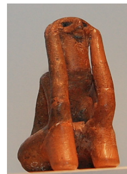
Gânditorul de la Târpești