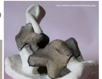
Gânditoarea de la Pietrele (jud. Giurgiu)

Și acum vin întrebările: pe cine ați mai văzut în zilele noastre în această postură? Cine mai este atât de îngrijorat de propria soartă, de familie, de țară? Și, unde ne mai sunt gânditorii?