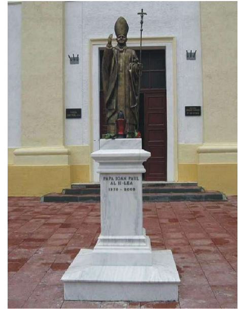
Monumentul Papei Ioan Paul al II-lea de la Suceava, dezvelit în fața bisericii Sfântul Ioan Nepomuk http://proalba.ro/la-blaj-va-avea-loc-sfintirea-statuii-sfantului-papa-ioan-paul-al-ii-lea