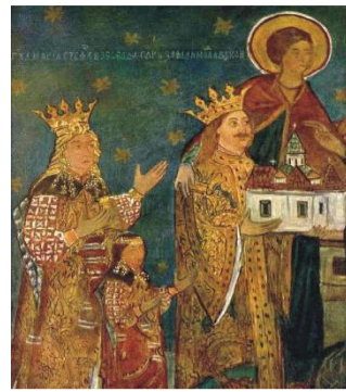
Portretul de la Voroneț al lui Ștefan cel Mare și al familiei sale