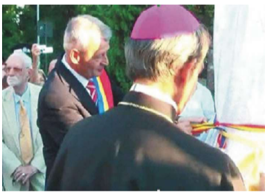
Ceremonia dezvelirii și sfințirii bustului din București al Fericitului Papă Ioan Paul II

Academicianul Răzvan Theodorescu a rememorat, asemenea tuturor vorbitorilor, istorica vizită a unui Episcop al Romei în România: Venea în România, la invitația Patriarhului Teoctist, nu doar cel mai important conducător spiritual al catolicismului din timpurile moderne, ci și, cu siguranță, cea mai importantă personalitate cu care generația noastră a fost contemporană. (...) Fie ca generația sa de pe acest soclu să ne amintească mereu de un excepțional oaspete al Bucureștiului cu drept cuvânt devenit recent un Fericit care anunță în viitorul apropiat un Sfânt ”.