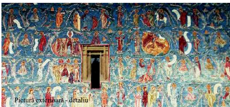
Pictură exterioară - detaliu

Surse: manastireavoronet.ro; identitatea.ro; romanianmonasteries.org; crestinortodox.ro; savizitam.ro; adevarul.ro; tripadvisor.com; ideidevacanta.ro; basilica.ro