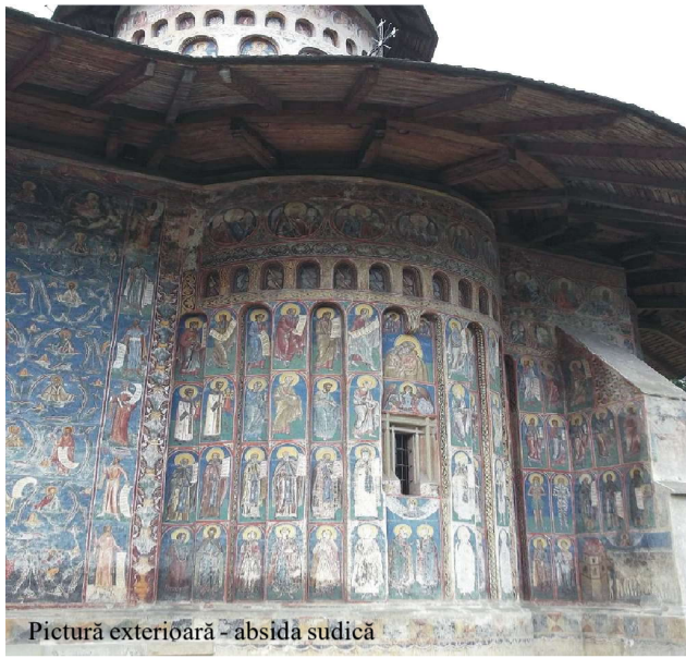
Pictură exterioară - absida sudică