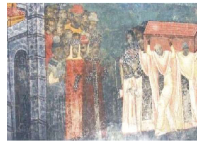
Frescă cu Alexandru cel Bun la Întâmpinarea moaștelor Sfântului Ioan cel Nou