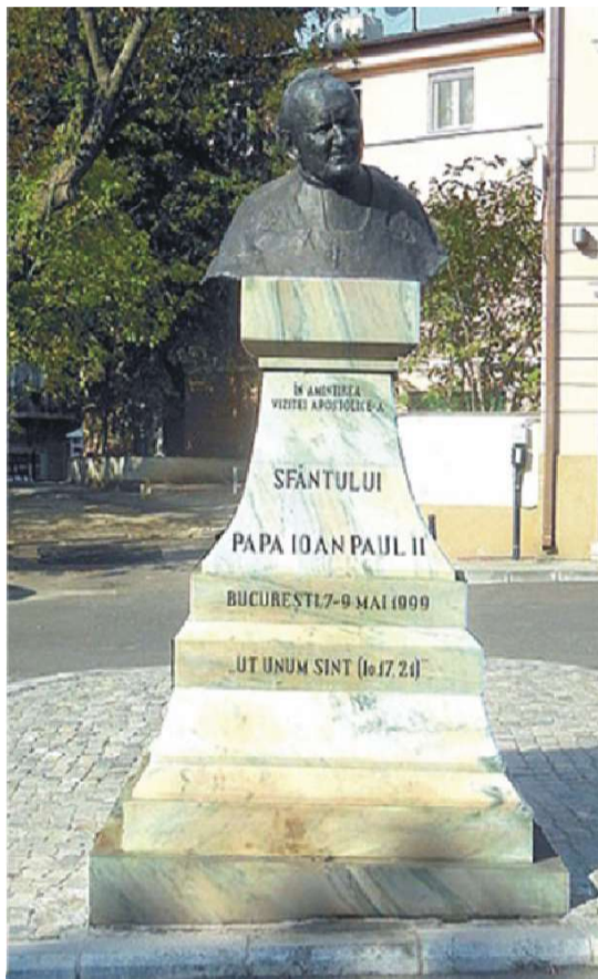
Bustul din Piața Stahi