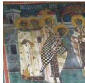
Frescă cu acatistul Sfântului Nicolae (detalii)