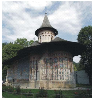
Biserica Sfântul Gheorghe din incinta Mănăstirii Voroneț