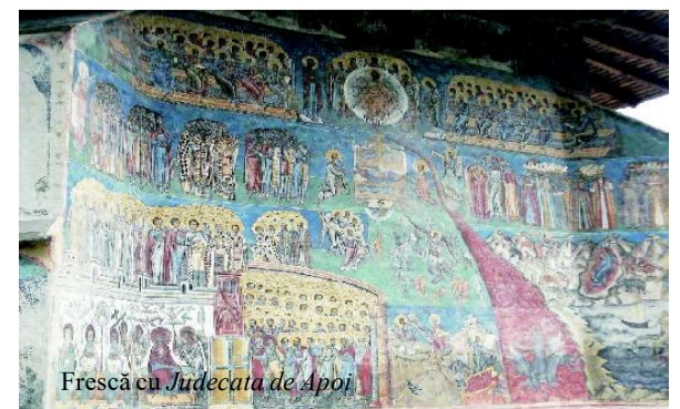
Frescă cu Judecata de Apoi