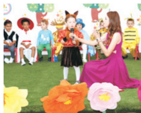
Grupa Lepurașilor – GRĂDINIȚA DIN PĂDURE