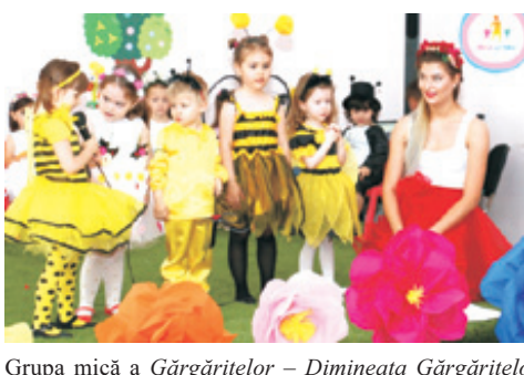
Grupa mică a Gărgărițelor – Dimineața Gărgărițelor