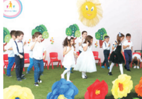
Grupa Dinozaurilor – Arc peste timp