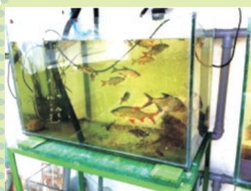
Acvarii cu: pești/plante/moluște/crustacee/insecte