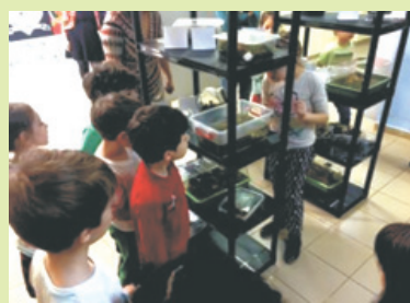
Expoziție mobilă de Biodiversitate și Terarii