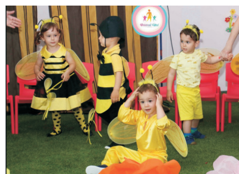
Grupa Albinuțelor – ZUM-ZUM ALBINUȚELE