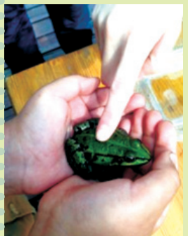
Dacă ești liniștit, cu gânduri de bine, speciile simt ...