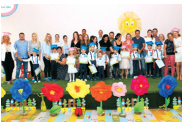
Absolenții Grădiniței Prietenii Mei, promoția 2016-2019 Grupa Ursuleților - Rămâi cu bine, grădiniță dragă!