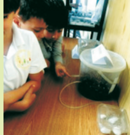
Traseele furnicilor pe niște tuburi transparente, către hrană și apă îi fascinează pe copii...