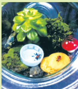
TERARIU în borcan etanș. Cu mușchi, licheni, o plantă și câteva insecte (faună): Vaca Domnului .