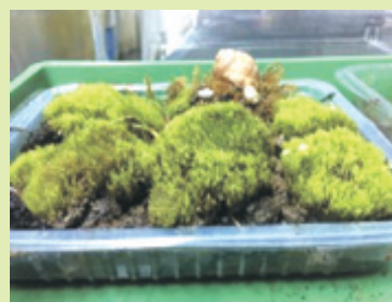
TERARIU cu mușchi și licheni și câțiva melci