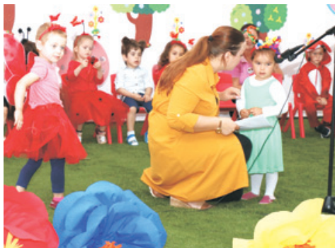
Grupa Fluturașilor în CARNAVALUL DIN PĂDURE

Și pentru că v-am spus de serbări, iată câteva imagini, care nu ai nevoie de cuvinte!