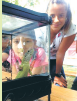
Oare ce mănâncă o șopărlă?