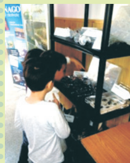
Pentru unii e prima dată când văd în realitate insecte....