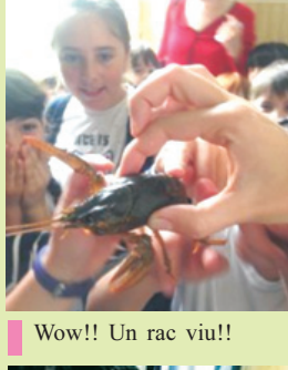
Wow!! Un rac viu!!