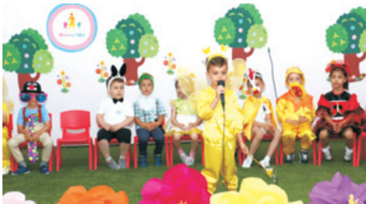
Grupa Căprioarelor - Serbarea Gâzelor și a Florilor.