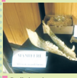
Ce dinți mari are...