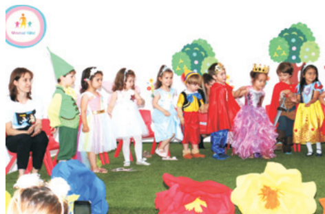
Grupa Greierașilor – Carnavalul Prinților și Prințeselor