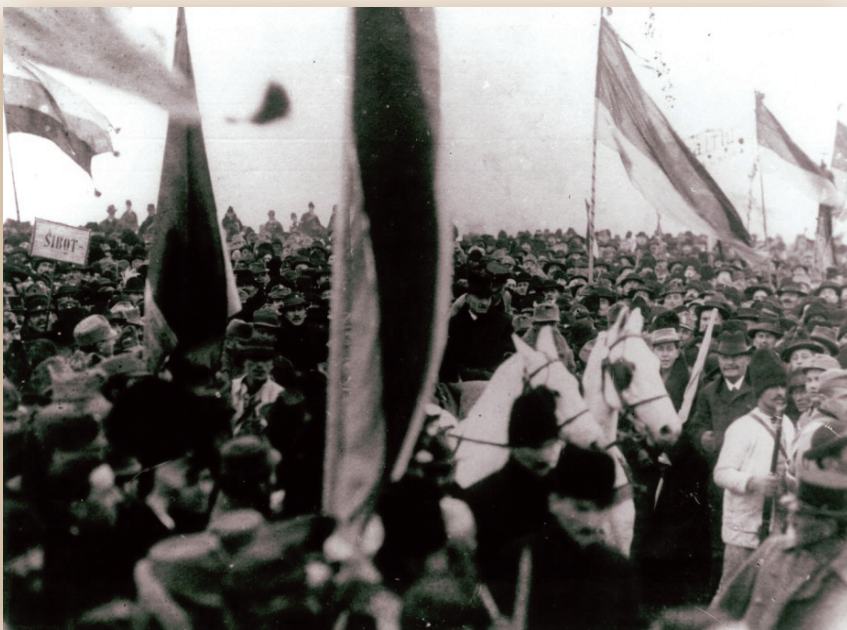
Mulțimea adunată la Alba Iulia cântă Deșteaptă-te române

Izbanda Ziar democratic independent 14 ianuarie 1919