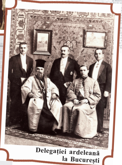
Delegației ardelenă la București