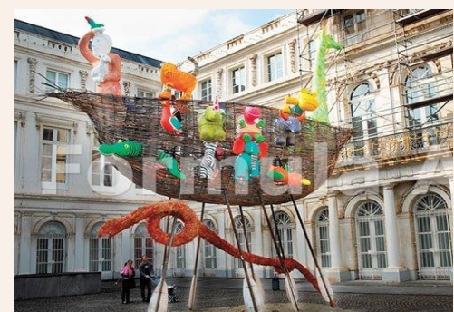
„Arca lui Noe” (Bruxelles, 2008)