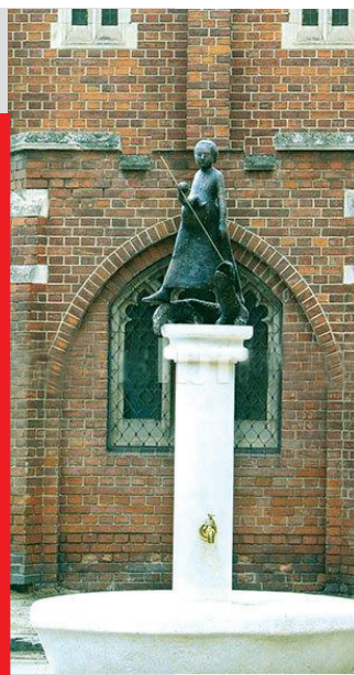
Statuia de lângă Biserica Anglicană

La PROMENADĂ printre operele măiestre ale sculptorului Virgil Scripcariu