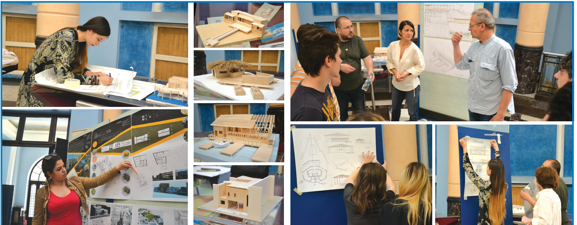
Predare și susținere de proiecte la Facultatea de Arhitectură