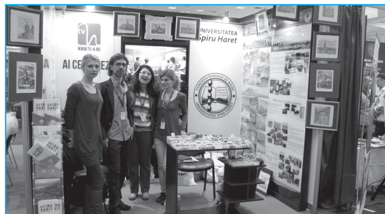
Universitatea Spiru Haret a participat la Târgul de Turism al României, organizat și găzduit de Romexpo, în perioada 25-28 februarie, cu standul Facultății de Matematică, Informatică și Științele Naturii și standul TVH