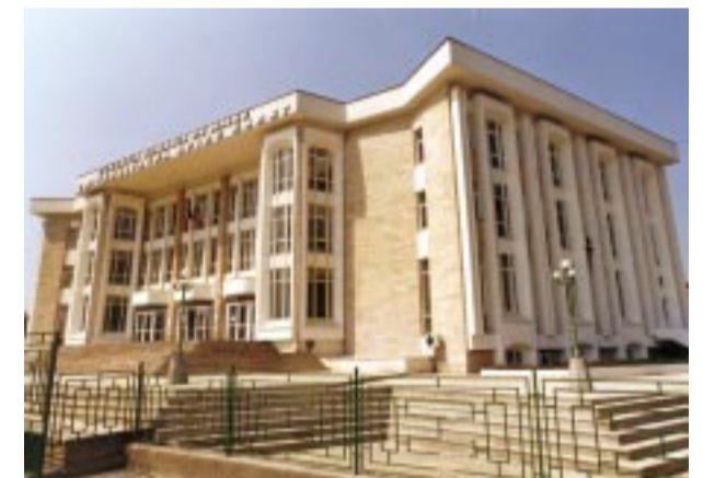
Edificiul din Șos. Berceni, nr. 24 și Aula Magna din acest edificiu