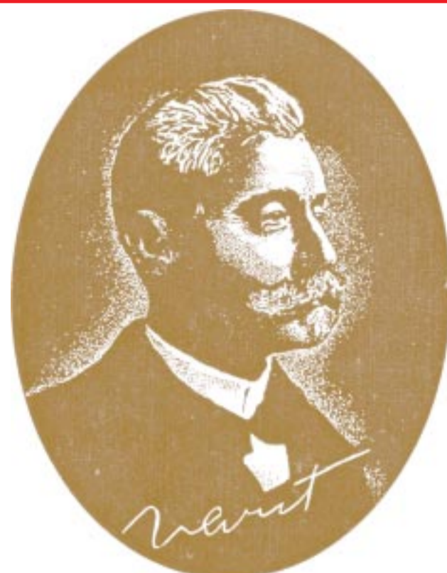
Spiru Haret 1851-1912

Săptămânal de opinie, informație și idei de larg interes național