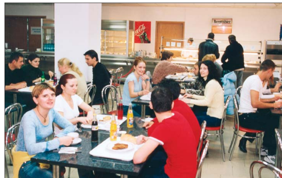
Aspect din cantina-restaurant (b-dul Metalurgiei nr.87)