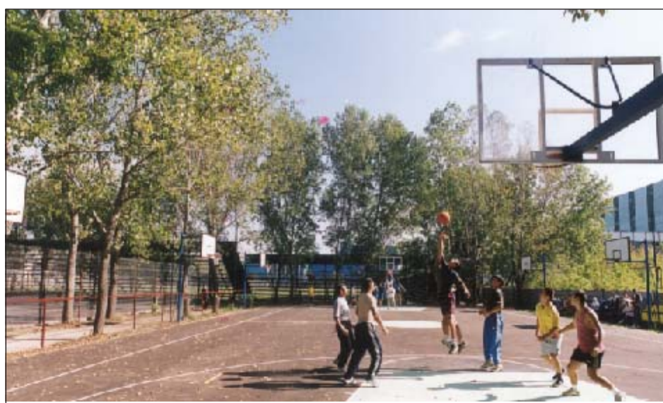
Aspect de la Baza sportivă din Șoseaua Berceni nr.104