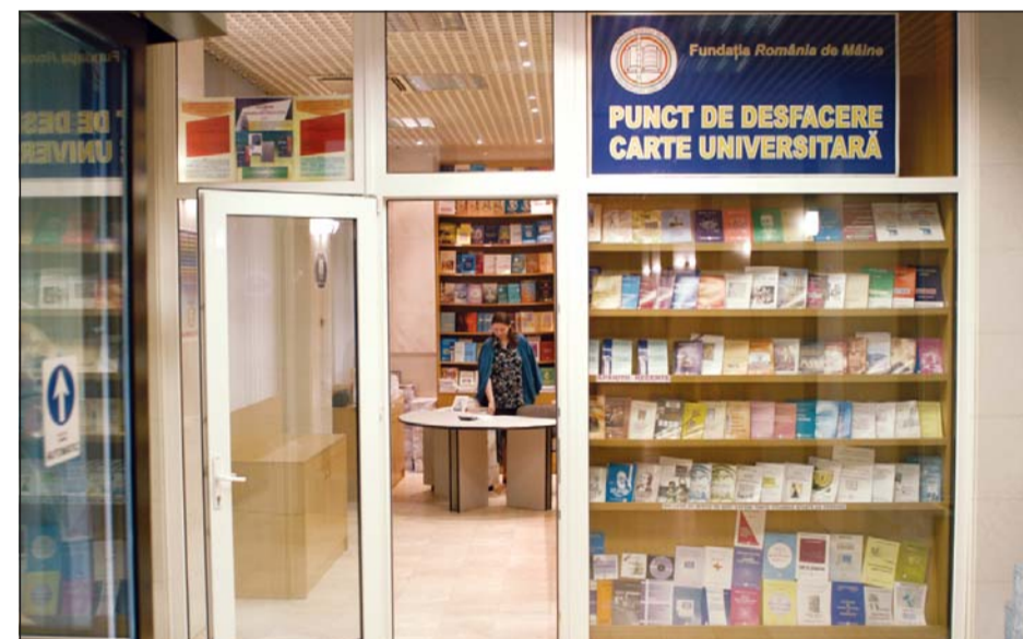
Punct de desfăcere a cărții universitare, amplasat la parterul Palatului Învățământului, Științei și Culturii (str. Ion Ghica nr.13)