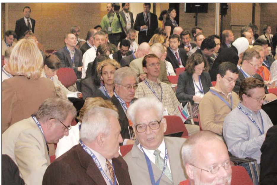
Aspect de la deschiderea oficială a Târgului Mondial al Educației, Lisabona, 20 mai 2003