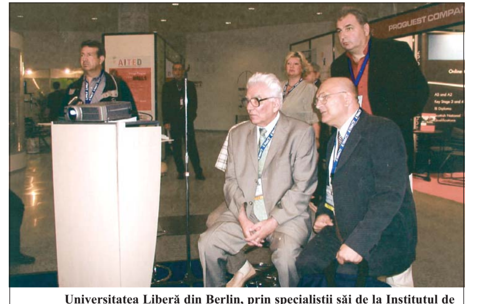
Universitatea Liberă din Berlin, prin specialiștii săi de la Institutul de Informatică, a realizat o nouă și performantă tehnologie – tabla electronică E-chalk, care face posibilă utilizarea simultană a calculatorului, Internet-ului și televiziunii în învățământul la distanță. În imagine, o demonstrație pentru delegația Universității Spiru Haret