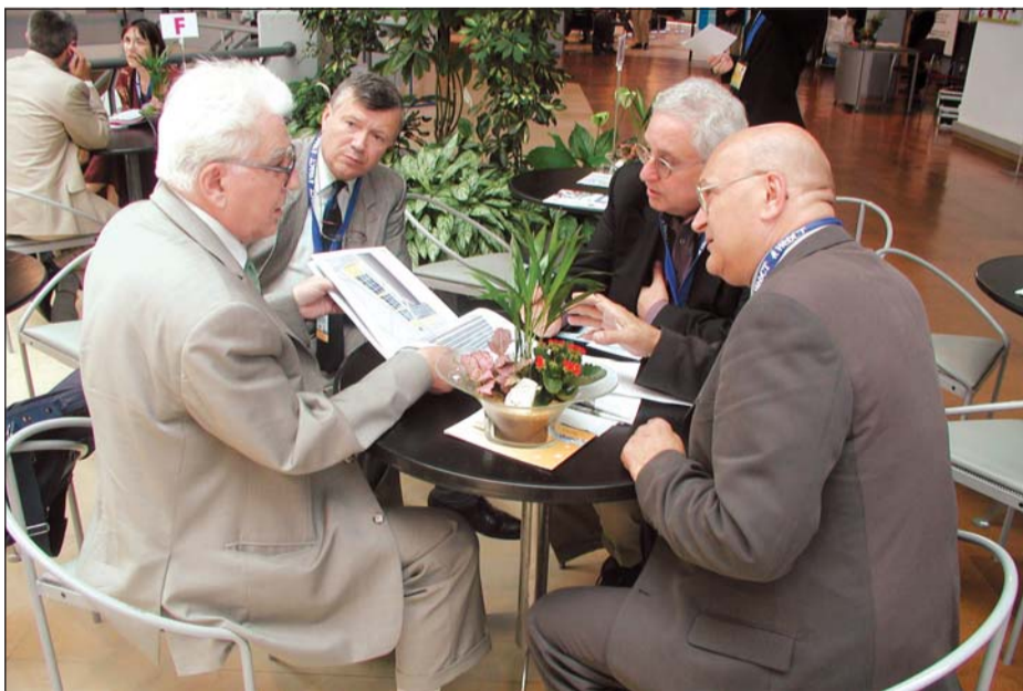
Rectorul Universității Spiru Haret a avut convorbiri cu reprezentanți ai Băncii Mondiale. Discuțiile purtate au vizat posibilitatea finanțării construcției Complexului Universitar și Cultural România de Măine