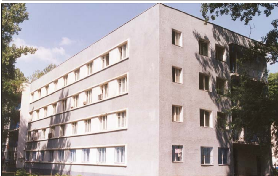
Unul din cele 3 cămine pentru studenți (Aleea Moldovița nr.5-10)