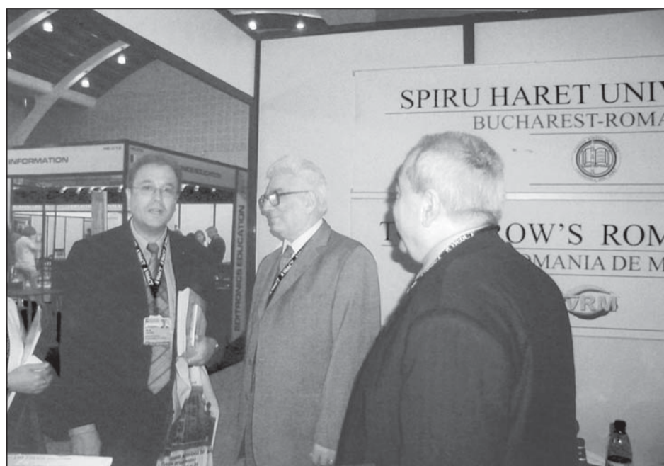
Intrevederi la standul Universității Spiru Haret de la Târgul Mondial al Educației

pregătită să răspundă provocărilor secolului XXI în sfera educației Învățământul la distanță, bazat pe calculator, Internet, televiziune - învățământul viitorului