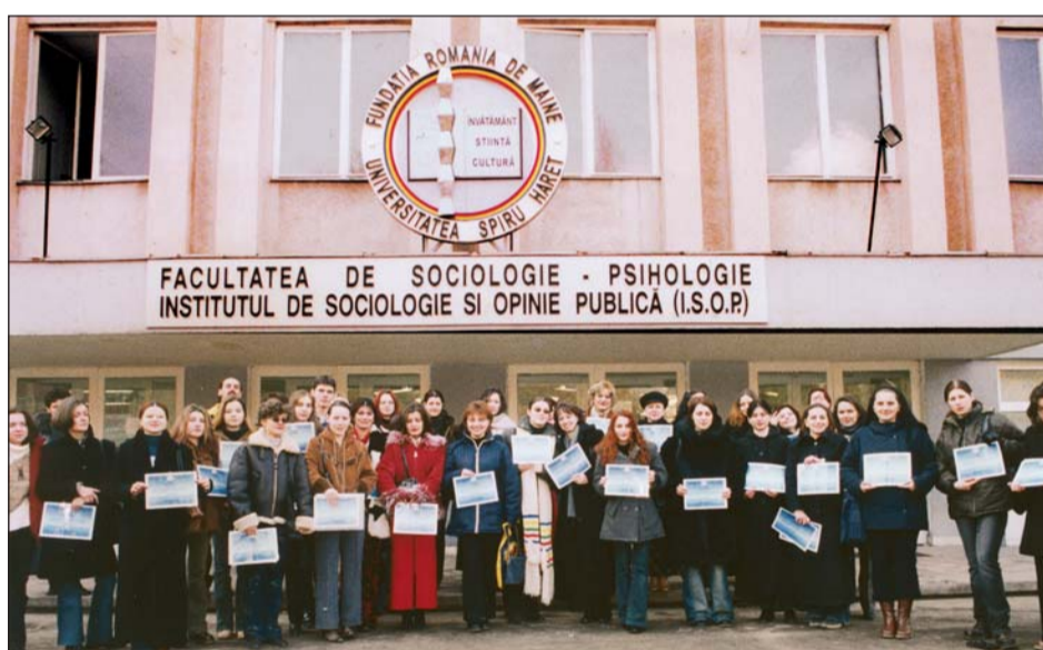
Aspect de la înmânarea diplomelor pentru burse de merit la Facultatea de Sociologie-Psihologie (martie 2003)

(Extrase din Hotărârea Senatului Universității Spiru Haret)