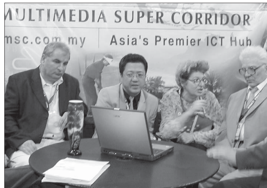
La un stand cu aparatură electronică destinată modernizării procesului de învățământ