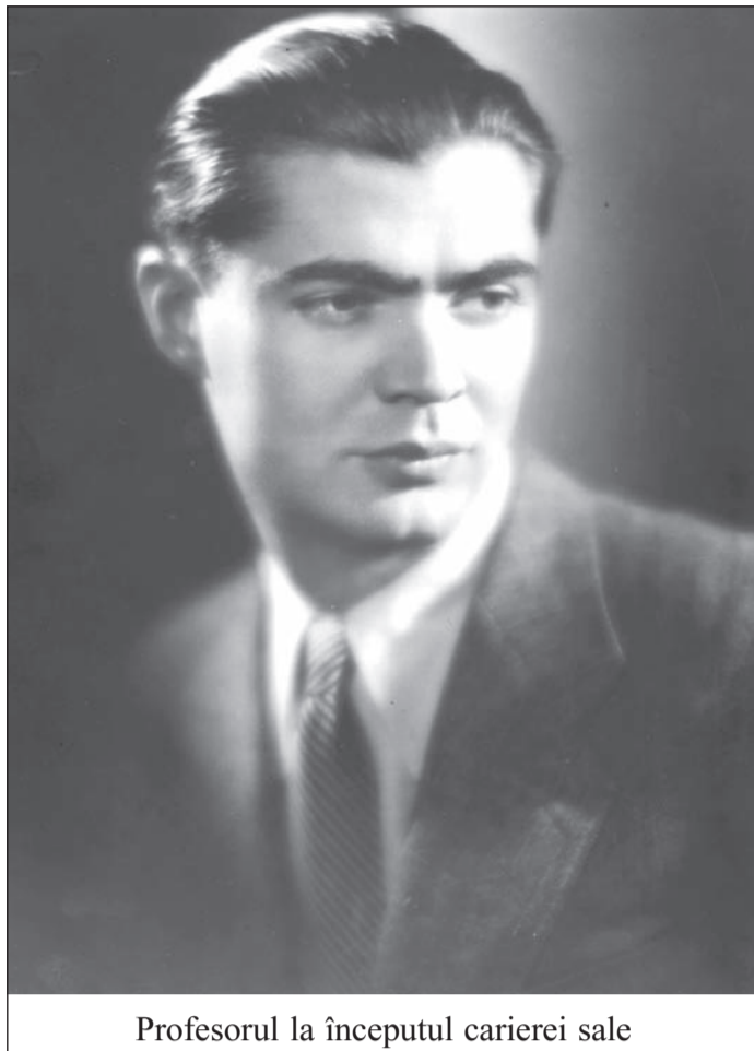
Profesorul la începutul carierei sale

A fost un om cu o putere de muncă ieșită din comun. Tatăl meu îmi povestea, că a făcut facultatea în această casă, a stat la mătușa lui, părinții erau la Buzău, după ce a terminat liceul a venit și a stat și a lucrat în această casă toată perioada studenției și a primilor ani de ucenicie în meseria medicală și tatăl meu, care locuia sus la etaj, îmi spunea că seara când venea acasă din oraș, la ore mai târzii, îl găsea cu lumina aprinsă studiind la birou, cu cărți, cu planșe, cu desene, cu scheme și dimineața la patru jumătate – cinci îl auzea făcând duș și cântând. Zicea: când a dormit omul ăsta? Acum pleacă la spital, la ora 6,30-7 fără un sfert-vară, iarnă, nu conta când-și când se întorcea acasă se apuca din nou de studiu până la 2-3 noaptea. Dormea extrem de puțin, muncea imens. Și toată activitatea lui, toate performanțele lui, profesionale medicale și umane, au arătat acest lucru: că munca aceasta, pasionată și extrem de ordonată, a dat niște rezultate formidabile.