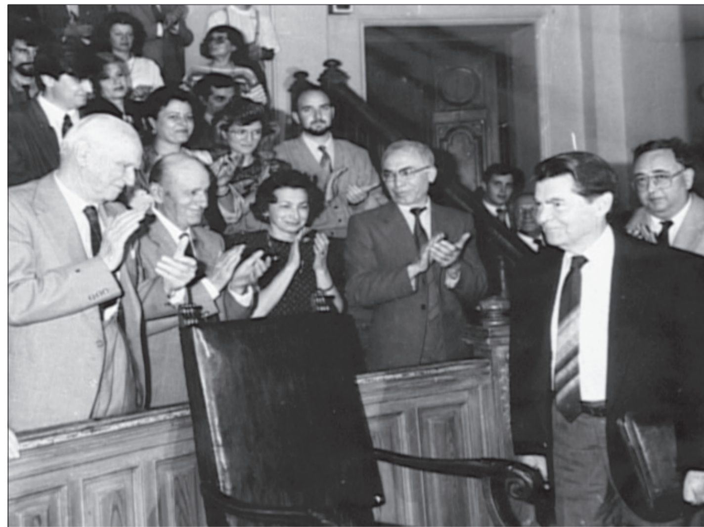
În Amfiteatrul mare al Facultății de Medicină din București (1994)

Am avut mult sprijin din partea profesorului Palade care vorbea cu autoritățile noastre și putea să le spună: „Profitați, e o ocazie extraordinară, acești oameni vor să vină acasă, vor să facă ceva acolo!” Era destul de sceptic la început în privința proiectului de a face un institut în România. Totdeauna îl considera și chiar îl numea „Experimental Simionescu”, dar în momentul în care a văzut că noi suntem hotărâți să facem asta și că n-am avut niciodată alt gând, ne-a sprijinit extraordinar de puternic.