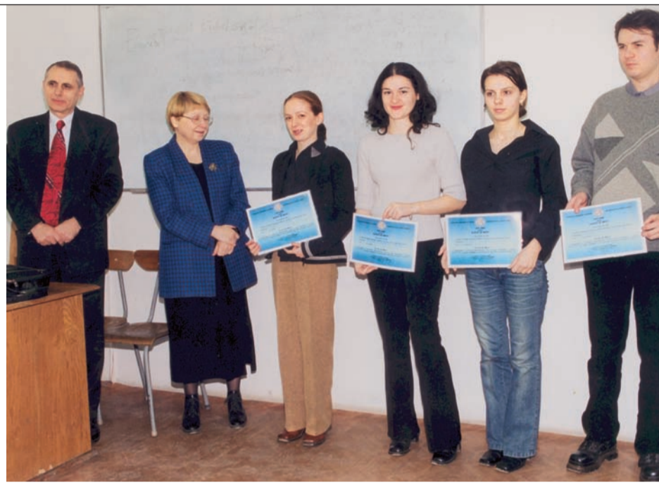
La Facultatea de Filosofie - Jurnalism