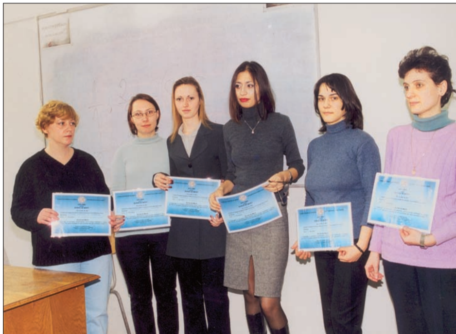
La Facultatea de Management Financiar-Contabil

a acordat burse de merit, în valoare totală de 2.000.000.000 lei, studenților Universității Spiru Haret care au obținut rezultate deosebite în pregătirea profesională