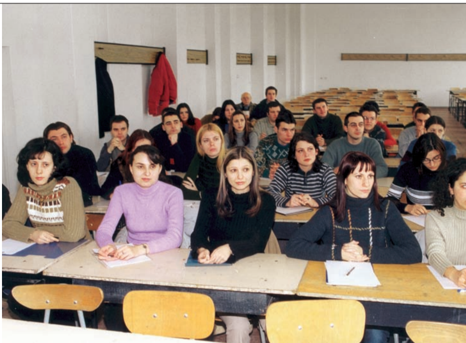
La Facultatea de Marketing și Comerț Exterior, asistența