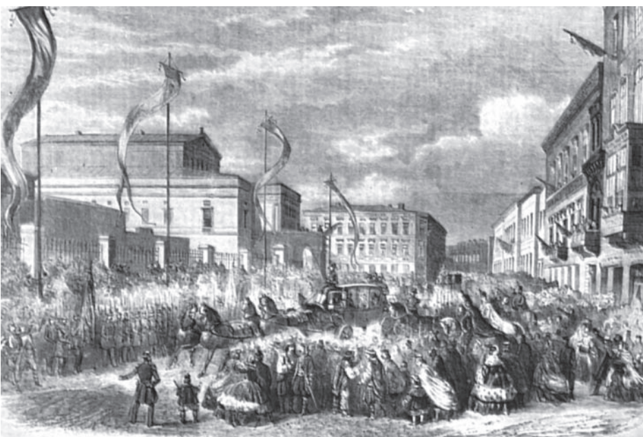
Ianuarie 1862. În ziua deschiderii primei Adunări Legislative a României, bucurăstii aclamă pe principele Al. I. Cuza, la trecerea sa pe Podul Mogoșoaia, spre sediul Adunării (gravură contemporană)

O astfel de abordare frontală a problematicii balanței comerciale în publicistica eminesciană își avea rădăcini puternice în realitatea vieții economice românești din ultimul sfert de veac al secolului al XIX-lea, când timp de peste 20 de ani, între 1877 și 1899, balanța comercială a României, cu o singură excepție în anul 1890, înregistrează solduri cronice deficitare, după ce din 1859 până în 1876 soldurile, an de an, fuseseră excedentare.