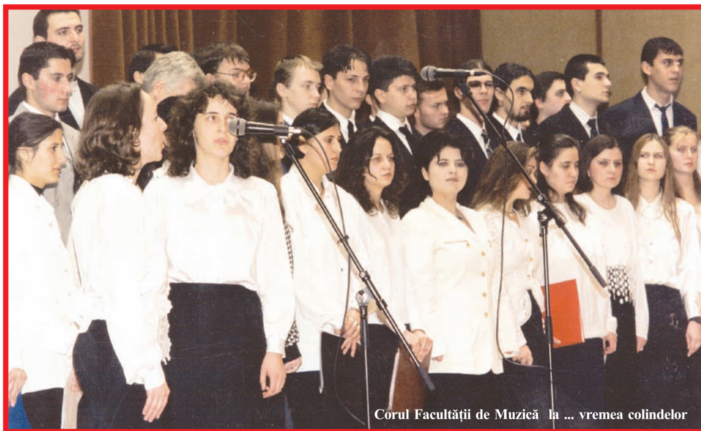
Corul Facultății de Muzică la ... vremea colindelor