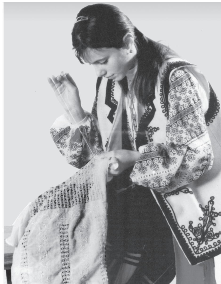
TÂRGUL NAȚIONAL DE ARTĂ POPULARĂ ȘI ARTIZANAT