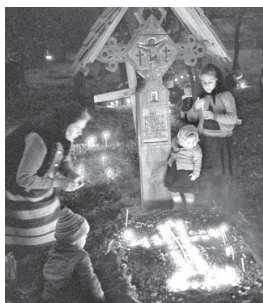
Veșnicia s-a născut la sat Locație de fotografat: de Andrei Pandelescu 22 februarie - 15 noiembrie 2015, Sala Foaier Muzeul Național al Țăranului Român Soseala Kibicki, nr. 3 www.muzeulromaniei.ro

Muzeului Național al Satului Dimitrie Gusti , Asociația Brand de Țară i-a decernat primul certificat Brand de țară , în cadrul conferinței publice Produsul românesc - Brand de țară , organizată sub egida programului Suntem România .