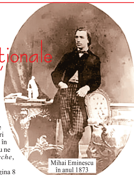
Mihai Eminescu în anul 1873

La 15 ianuarie sărbătorim Ziua Culturii Naționale și nașterea, în urmă cu 165 de ani, a poetului Mihai Eminescu. Ziua Culturii Naționale este o zi în care nu doar celebrăm un mare creator, dar și o zi de reflecție asupra culturii române, în general, și a proiectelor culturale de interes național. De altfel, și în alte țări, aniversarea unor personalități culturale naționale reprezintă pretextul pentru serbări publice, lecturi, dezbateri publice, târguri de carte, manifestări culturale de renume, ca în cazul lui Dante, în Italia, Cervantes în Spania etc. Același lucru ne dorim și pentru România de ziua poetului nepereche, Mihai Eminescu, Ziua Culturii Naționale.