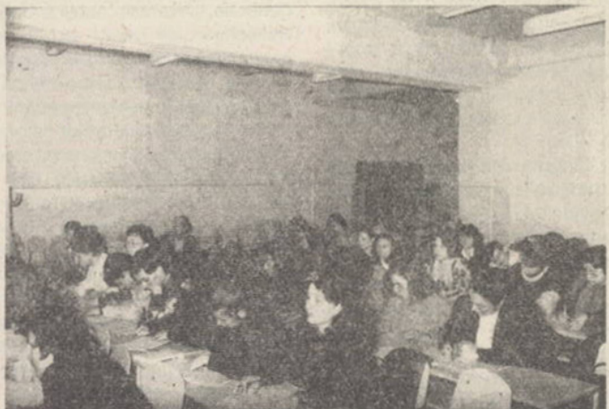
Ore de curs