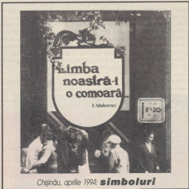
Chișinău, aprilie 1994: simboluri