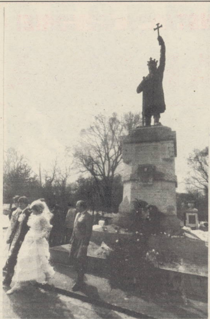
Chișinău, aprilie 1994: simboluri