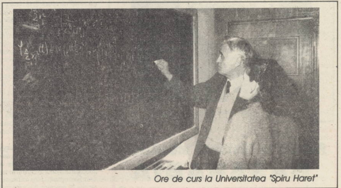
Ore de curs la Universitatea "Spiru Haret"