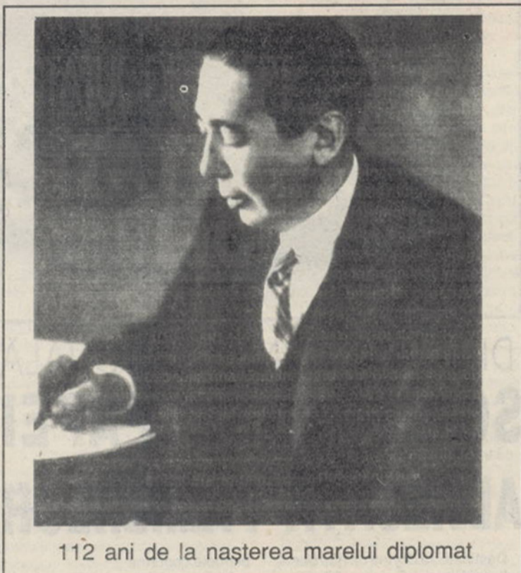
112 ani de la nașterea marelui diplomat

Caracterizat succint, diapazonul vederilor și pozițiilor lui Nicolae Titulescu în problemele relațiilor internaționale cuprinde, într-o viziune dialectică, adeziunea neștrămutată la promovarea intereselor vitale ale ambilor poli ai acestor relații: națiunea proprie și umanitatea. "Ca român, născut din părinți români, crescut la școala lui Take Ionescu și a lui Vintilă Brătianu - declara el în 1936 - fac din naționalismul (patriotismul - n.n.) românesc o dogmă atât în afară cât și înăuntru. Nu dau dreptul nimănui din afară să se amestece în treburile noastre launtrice; cer, dimpotrivă, ca directivele politicii noastre interne să fie pur românești". Și definind cealaltă față a medaliei, diplomatul român declara în 1933: "Relele provin din faptul că națiunile nu-și dau seama că, în ciuda tuturor deosebirilor, ele alcătuiesc, la urma urmelor, un tot indivizibil. Omul nu poate fi străin omului numai prin faptul că între ei se ridică o graniță. Și pacea nu înseamnă nimic altceva decât conștiința universalității speței umane".