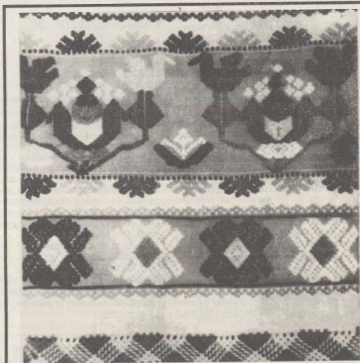
Oglindind marea îndemănare, fantezia, forța creatoare, altfel spus, talentul și simțul artistic deosebit al femeilor din satele noastre, țesăturile și cusăturile acoperă un vast sector al artei populare din România. Câteva creații din acest bogat tezaur național ne-au prilejuit ilustrarea numărului actual al revistei noastre.

OPINII DE ACTUALITATE ÎN "OPINIA națională"