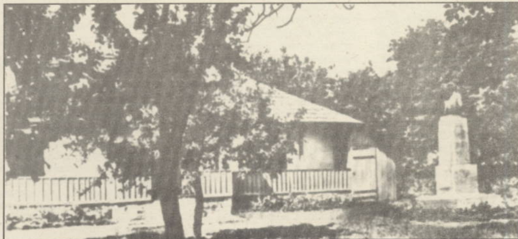
Casa din Liveni în care s-a născut, la 19 august 1881, George Enescu.