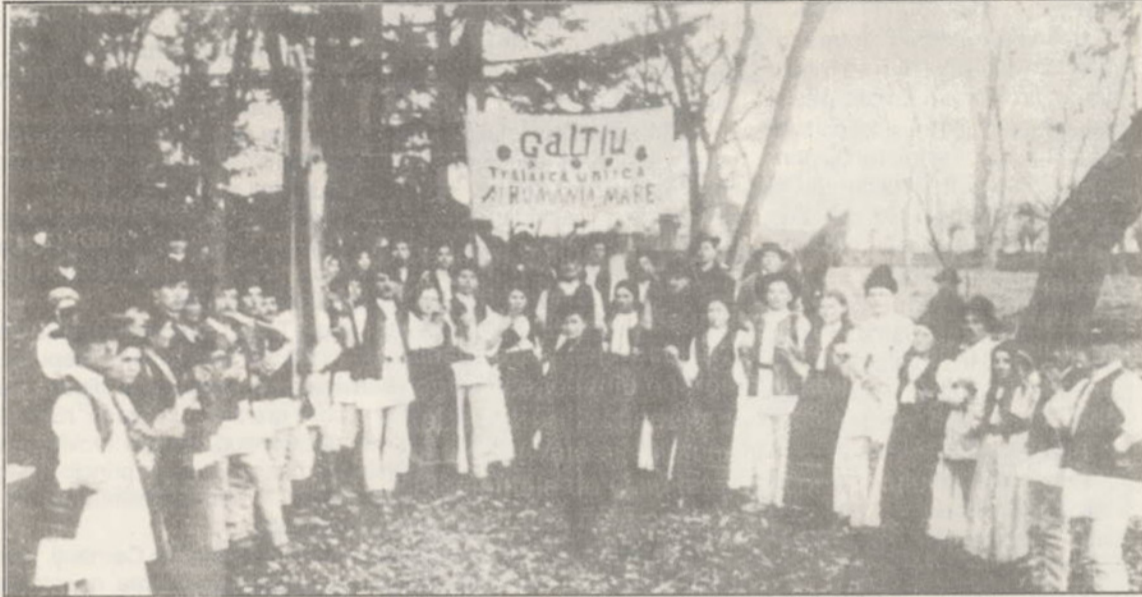
Participanții la evenimentul istoric de la 1 Decembrie 1918. În imagine: un grup de delegați din comuna Galțiu la Marea Adunare Națională de la Alba Iulia - câțiva din cei peste 100 000.

noi, cu vechiul nume) pe jos și cu căruțele... Era o dimineață rece de iarnă. Respirația se întrupa în invizibile cristale. Pe o parte a șoselei se duceau spre Alba-Iulia, scrâșnind prin făgașele zăpezii, căruțele românești, buchete de chiote și bucurie, alcătuiind un singur șir, iar pe cealaltă parte se retrăgea în aceeași direcție armata germană, ce venea din România, tun după tun, ca niște pumni strânși ai tăcerii. Soldații germani, fumegând liniștiți din pipe, se uitau mirați după căruțele noastre mai grăbite. Ei își luau răgaz. Nu s-a produs nici un incident. <<Uite, îi spun lui Lionel, [frate mai mare al lui Blaga, fost <<comisar al poporului răzvrătit>>, la Sebeș, în acele zile], așa, prin ger și zăpadă, se retrăgea pe vremuri Napoleon din Rusia.>> <<La Alba-Iulia - continuă Lucian Blaga - nu mi-am putut face loc în sala adunării. Lionel, care era în delegație, a intrat. Am renunțat c-o strângere de inimă și mă consolam cu speranța că voi afla de la fratele meu cuvânt despre toate. Aveam în schimb avantajul de a putea colinda din loc în loc, toată ziua, pe câmpul unde se aduna poporul. Era o roire de necrezut. Pe câmp se înălțau, ici-colo, tribunele de unde oratorii vorbeau nației. Pe vremea aceea nu erau microfoane, încât oratorii, cu