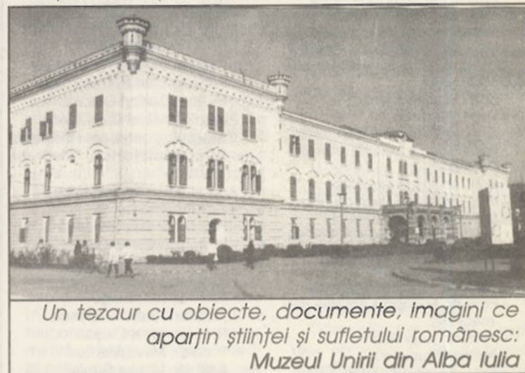
Un tezaur cu obiecte, documente, imagini ce aparțin științei și sufletului românesc: Muzeul Unirii din Alba Iulia