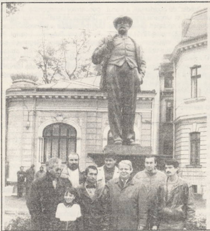
O statuie a marelui Ion Luca Caragiale, care - după o îndelungată absență - și-a reluat locul pe soclul de la intersecția străzilor I.L. Caragiale, C.A. Rosetti și Maria Rosetti din București. Restaurată, prin grija unui grup de cetățeni, valoroasa operă artistică vine să îmbogățească tezaurul de monumente al Capitalei.

A învăța din trecut înseamnă a face din prezent o durată a demnității naționale.