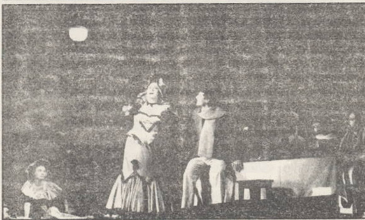
Eveniment artistic deosebit la OPERA NAȚIONALĂ: premiera operei Boema de Puccini, într-o nouă montare semnată de regizorul Hero Lupescu.