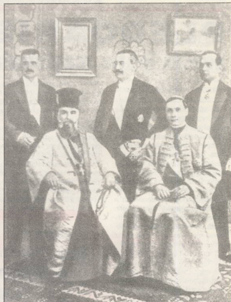
Delegația care a venit din Ardeal să predea Regelul Ferdinand Actul Unirii semnat la Alba Iulia: V. Goldiș, Al. Vaida-Voevod, Caius Brediceanu, Episcopul Dr. Miron Cristea și Episcopul Dr. Hossu.