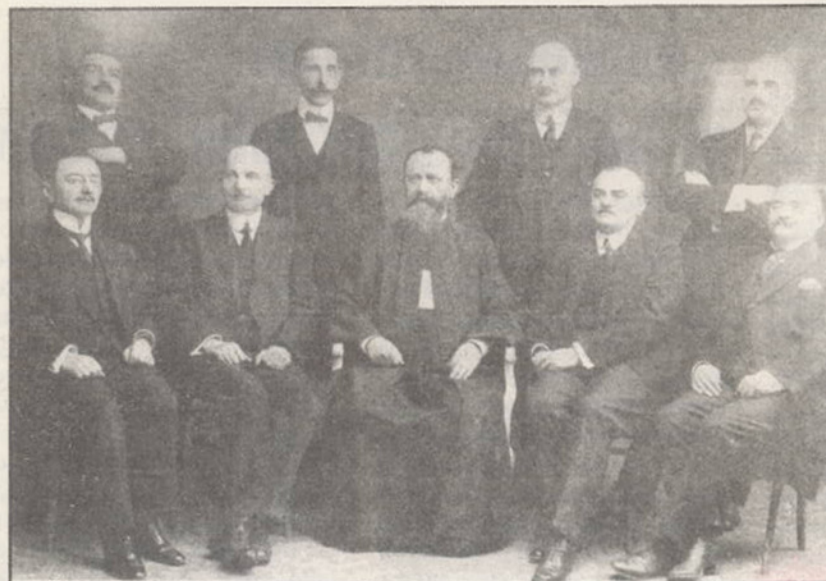
Membrii Comitetului Național Român la Alba Iulia