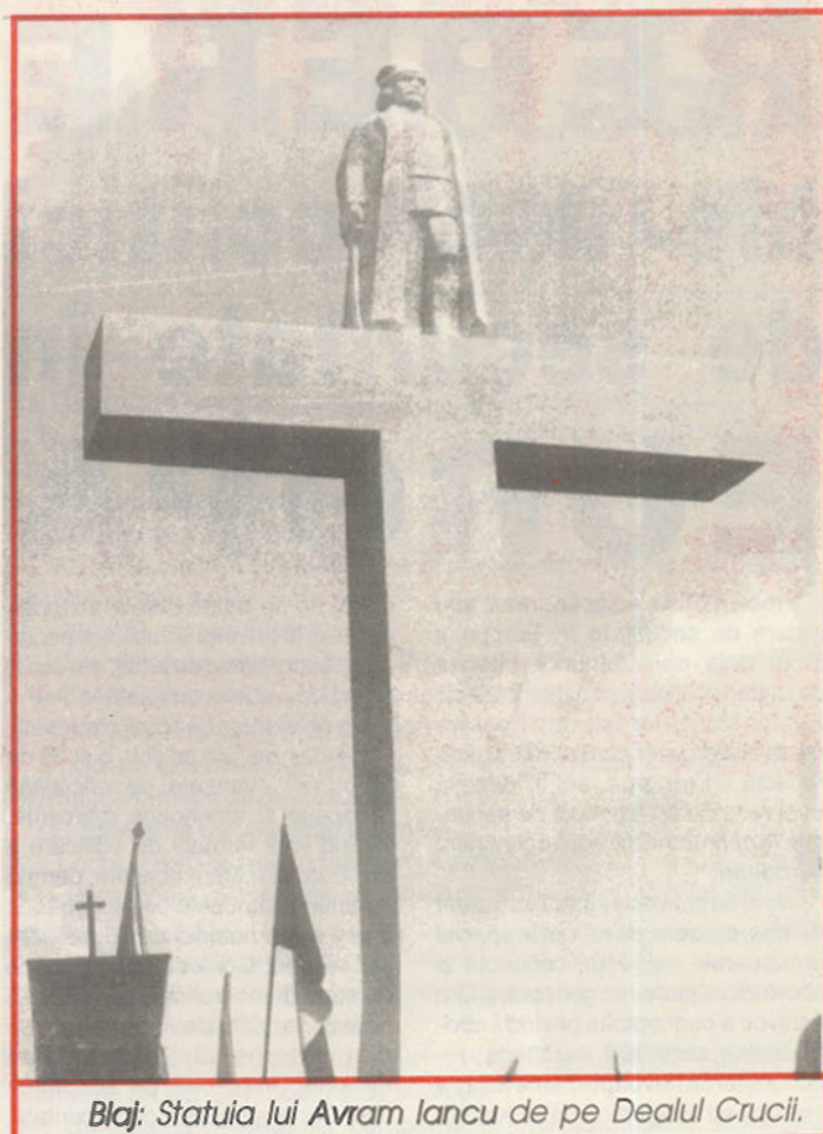
Blaj: Statuia lui Avram Iancu de pe Dealul Crucii.

- Cam pe post de singuri mohicani. De pildă, studiind programele unor centre sau lista unor turnee etc., nimic rău,