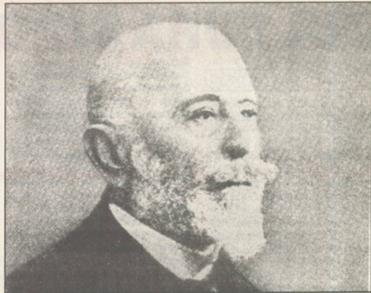
Gh. Pop de Băsești (1835 - 1919) președintele Adunării Naționale de la Alba Iulia, din 1 Decembrie 1918.