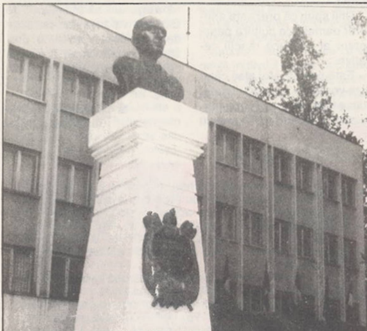
La 22 octombrie, la Slobozia, a avut loc ceremonia dezvelirii primului monument pentru cinstirea memoriei Mareșalului Ion Antonescu.

(Text prescurtat al articolului publicat în cotidianul britanic "THE INDEPENDENT").