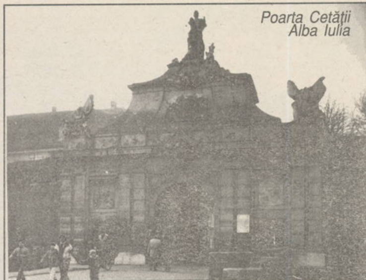
Poarta Cetății Alba Iulia

Deoarece mai sus a fost vorba despre autonomie culturală, administrativă, teritorială ș.a.m.d. trebuie observat că teze de acest fel sunt frecvent aduse în discuție în lumea de azi; unii autori dorind să combată ceea ce ei numesc "poziții simplificate", propagă teze dogmatice și dogmatizante, alimentează politica și cultura separatismului. Este desigur îndreptățit să se spună că "națiunea reprezintă o entitate reală" și că "orice forță politică din Europa Centrală și de Est care nu ține seama de conștiința națională a popoarelor, de sentimentul național este condamnată la pierire" (5) . Dar același autor susține că problema-cheie a stabilității Europei Centrale și de Est ar fi dispersarea sub forma "diferitelor variante ale autonomiilor", numindu-se direct aceste autonomii: culturală, teritorială, zonală sau regională, ca și combinații ale acestora. Simțind însă că se află pe un teren alunecos, dorind ca tezele sale să fie mai ușor acceptate, autorul previne, fără să poată și demonstra argumentat că