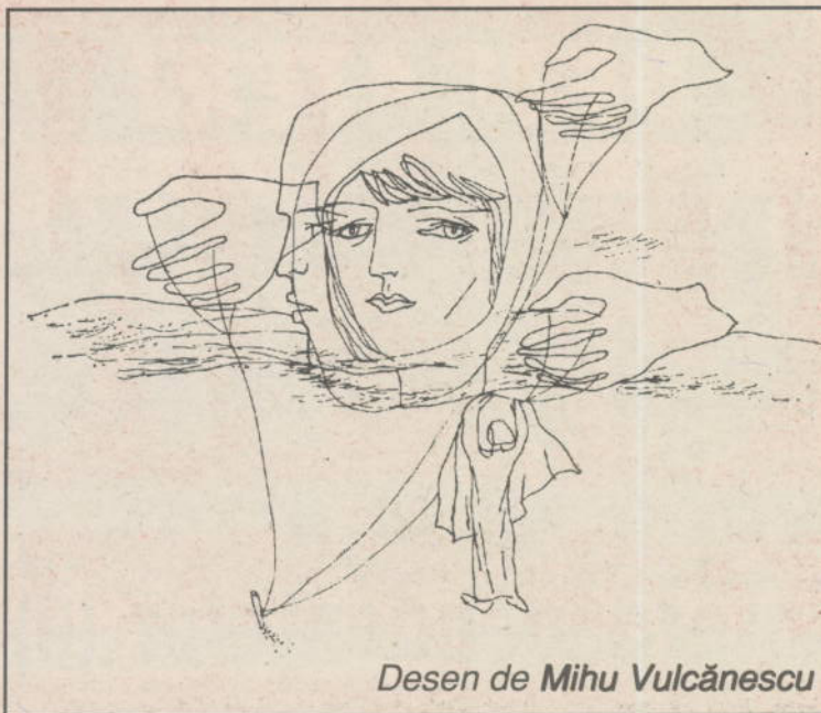
Desen de Mihu Vulcănescu