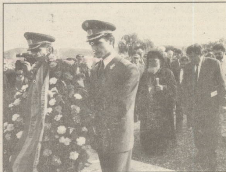
La 80 de ani de la tragica dispariție a marelui erou Aurel Vlaicu, flori și o impresionantă festivitate la monumentul de la Bănești.