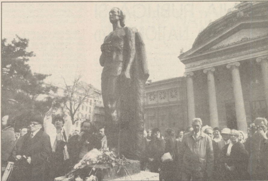
La monumentul celui ce întrușipează în mod desăvârșit ideea națională: Mihai Eminescu