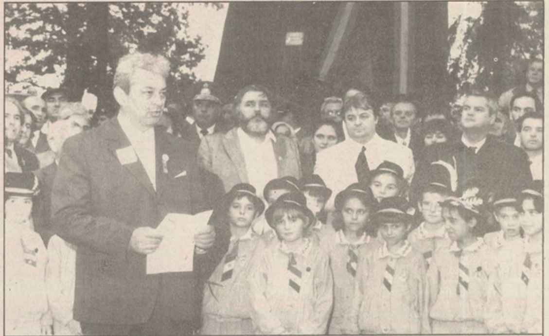
Tebea, septembrie 1993. Se aniversază, cu mare cinste, evenimentele revoluționare de la 1848. Uniți în cuget și simțiri, români din toate colțurile țării au venit aici pentru a comemora împlinirea a 121 de ani de la trecerea în neființă a celui ce și-a transformat numele în simbol al luptei pentru libertate națională - AVRAM IANCU