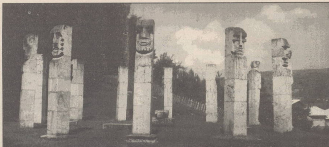
"Martirii de la Moisei", monument semnat de sculptorul Vida Geza.