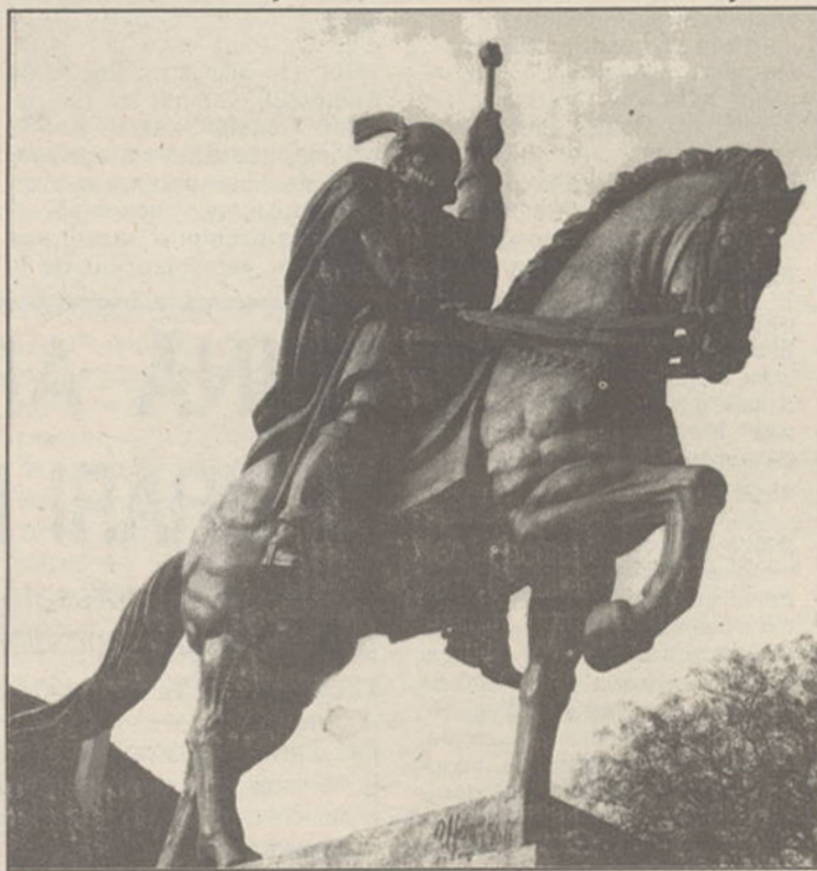
Monumentul de la Alba Iulia, ridicat aici, în inima țării, spre nepieritoare cinstire a marelui voievod Mihai Viteazul, "domn al Țării Românești, al Ardealului și a toată țara Moldovei".

În timp ce mișcările de eliberare a popoarelor din Balcani se intensificau, obligând Poarta să angajeze însemnate forțe militare ca să le înăbușe, o parte a statelor europene se grupau în "Liga Sfântă" con-