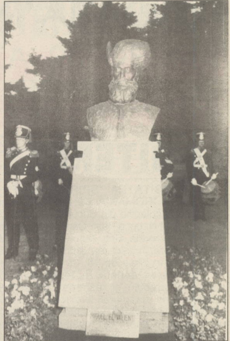
Semn al prețurii luptei poporului român pentru libertate și unitate națională, la Buenos-Aires, în Argentina a fost ridicat acest monument al lui Mihai Viteazul, dezvelit cu prilejul vizitei președintelui Ion Iliescu în această țară.

Numele lui Mihai Viteazul a fost asociat atunci cu cel al acțiunii hotărâte, al independenței și împlinirii naționale, al legământului, devenit testament pentru urmași, de a face pașnică unirea tuturor ținuturilor românești.