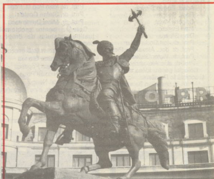
"Io Mihail voievod, din mila lui Dumnezeu, domn al Țării Românești, al Ardealului și a toată țara Moldovei". (Titulul lui Mihail Viteazul din hrisoavele sale din vara anului 1600). Urcat în scaunul Țării Românești în septembrie 1593, marele Domnitor avea să împlinescă voiața nepieritoare de unire a poporului român. Aniversarea înscăunării de acum 400 de ani, va fi cinstită cum se cuvine și în paginile revistei noastre.