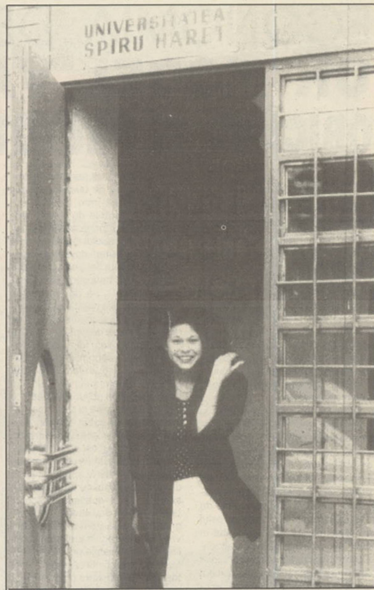
Se pare că nota la examen a dat satisfacția binemeritată.

- Nu se poate ajunge la contesta- ție, pentru că atât candidații cât și comisiile au interesul comun de a se asigura intrarea și parcurgerea în bune condiții a studiului, astfel încât să reziste concurenței profesionale. În plus, nimeni nu dorește să aibă studenți cu note mici și nici nu s-a întâmpat așa ceva în acești doi ani, Medicina având rezultate dintre cele mai bune. De asemenea, nu vrem să coboșăm ștacheta predării; mulți stu- denți, realmente interesați de buna lor pregătire, confruntând cunoștințele lor cu cele ale colegilor de la stat au putut constata că, la noi, au benefi-