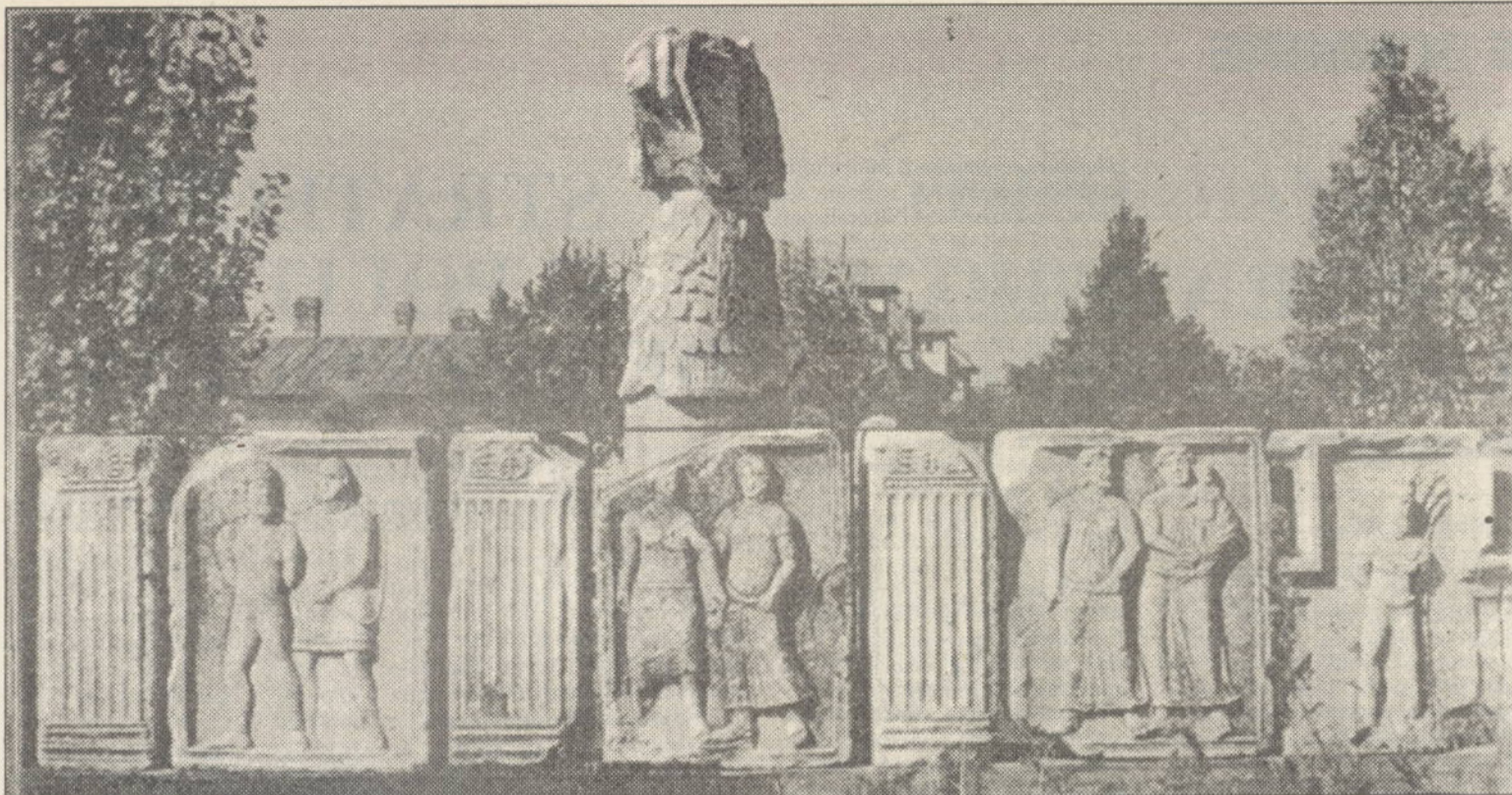
Fragmente din monumentul de la Adamclisi edificat în timpul stăpânirii Daciei de către romani.

Identitatea unui popor - afirmată de istorie - nu poate fi apreciată în dimensiunile ei reale fără raportarea valorilor care o definesc la cele ale istoriei universale, aceasta fiind sinteză și, totodată, factor important de influențare a istoriilor naționale. În discursul său de recepție la Academia Română (17 mai 1911), Nicolae Iorga - care ocupă în umanismul modern un loc de excepție - arăta: "Viața unui popor e neconținut amestecată cu viețile celorlalte, fiind în funcțiune de dans și înfrâurind neconținut viața acestora. Fiecare nație e o energie, având izvoarele și împrejurările ei deosebite, caracterul și misiunea ei specială. Dar niciuna din aceste energii nu se poate izola absolut pentru studiu și nu trebuie să fie izolată pentru aceasta".