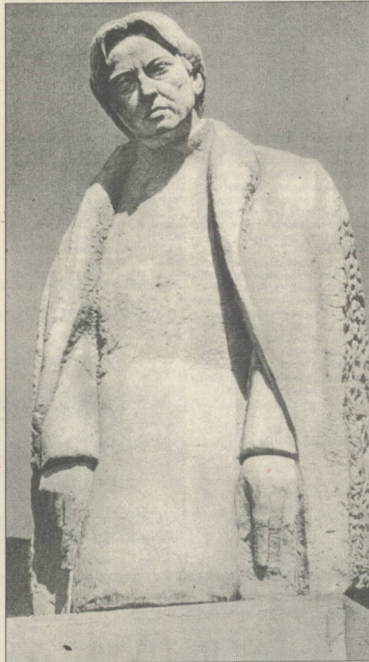
George Enescu Sculptură de G. Anghel

Așadar, nici un semn că el a fost compozitor român, un mare creator care, în tot ceea ce a lăsat pe portative, a cântat valorile spirituale și perene ale acestui popor, propagându-le larg, atât în spațiul cultural național, cât și în cel european și universal.