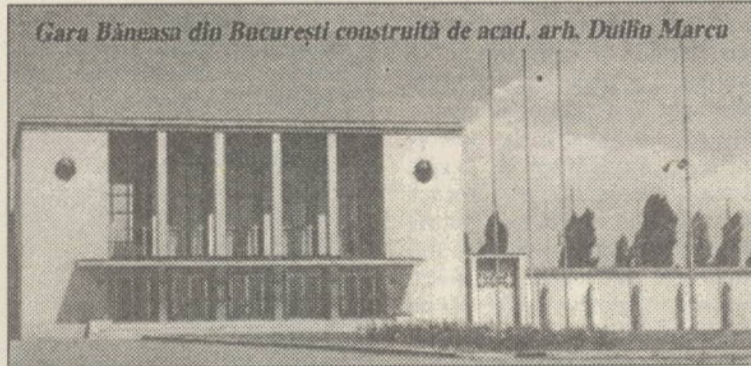
Gara Băneasa din București construită de acad. arh. Duilio Marcu

O concluzie generală este că dezvoltarea durabilă (viabilă) nu este o plăsmuire abstractă, ruptă de realități, ci o rezultantă a drumului deloc lin și bătătorit și a etapelor pe care le-a parcurs în ultima jumătate de secol procesul real al dezvoltării, o sinteză a opiniilor exprimate de oameni de diferite orientări științifice și politice preocupați de asigurarea progresului omenirii, un rezultat al confruntării în practică a unor modele și politici economice și sociale și a efectelor lor, însumând cunoștințele pe care le-a acumulat până acum omenirea despre propria dezvoltare în prezent și în perspectivă. De conținutul conceptului de dezvoltare durabilă ne vom ocupa mai pe larg într-un articol viitor.