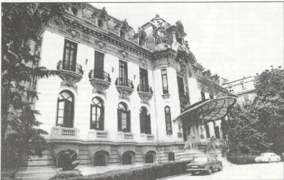
Casa muzeu "George Enescu" din București

Cu câtă neliniște lucra și cât de intens și complicat era procesul de sensibilitate și de inteligență pe care Enescu le trăia când pregătea interpretarea! Apoi, cât de exigent era cu el însuși, ce muncă enormă, ce efort de pătrundere a partiturii depunea pentru a ajunge la adevărata expresivitate cerută de operele muzicale de artă! (Va urma)