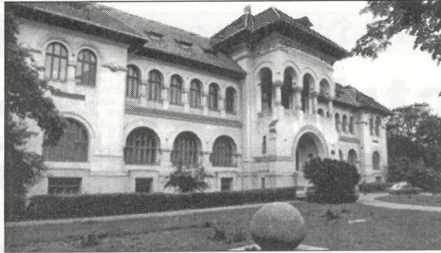
Muzeul Geologiei din București

Așadar, marketingul se definește ca un domeniu distinct al științelor economice prin faptul că apariția conceptelor și practicilor sale nu reprezintă substituirea lui altor științe economice, ci integrarea în sistemul acestora. Marketingul sintetizează și generalizează, din unghiuri proprii, cunoștințele existente, completează și dezvoltă aspecte noi ale teoriei și practicii economice, face reconsiderări asupra unor probleme din sfera științelor economice.