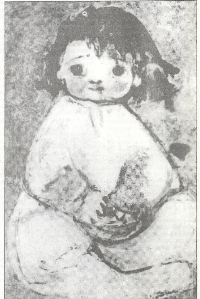
1 Iunie - "ZIUA INTERNAȚIONALĂ A COPILULUI"