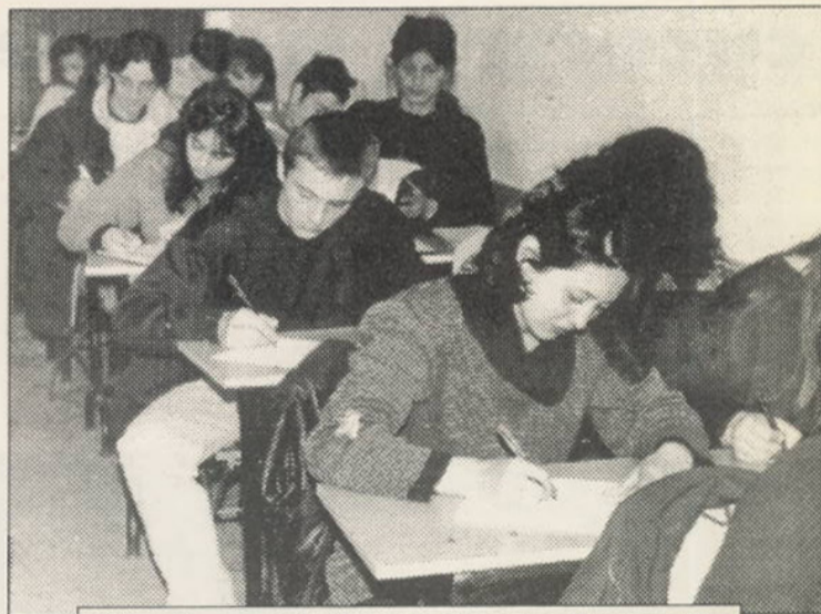
Ore de curs la Facultatea de Geografie