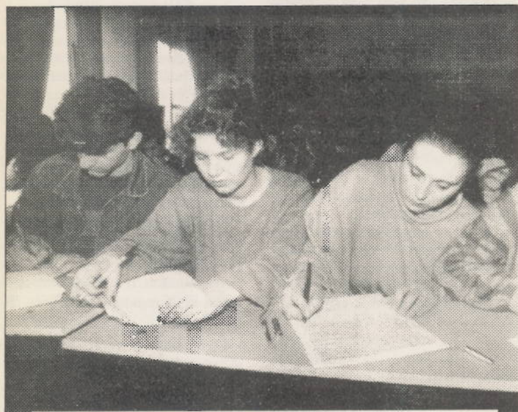
La Universitatea "Spiru Haret"