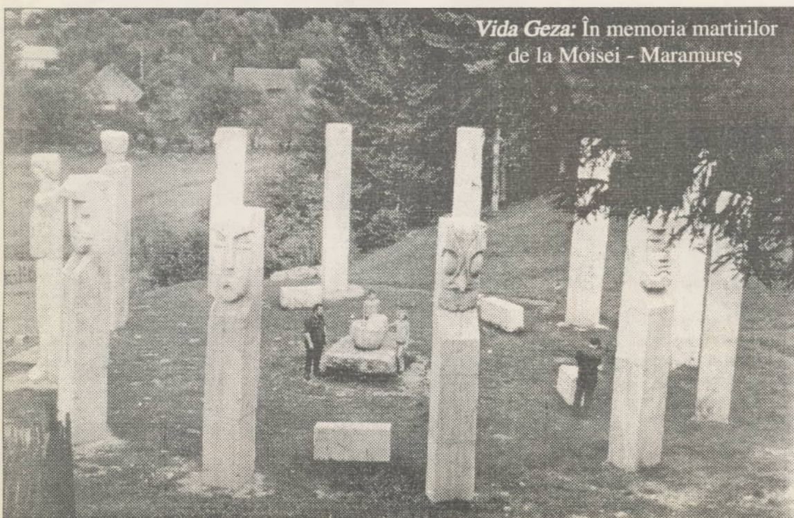
Vida Geza: În memoria martirilor de la Moisei - Maramureș

Implantarea națiunii române, cu atributele sale de unitate și independență într-o Europă cu popoare încă îngenuncheate, spârgea tipare și contamina mai ales în sud-estul continentului. După Unirea Princi-