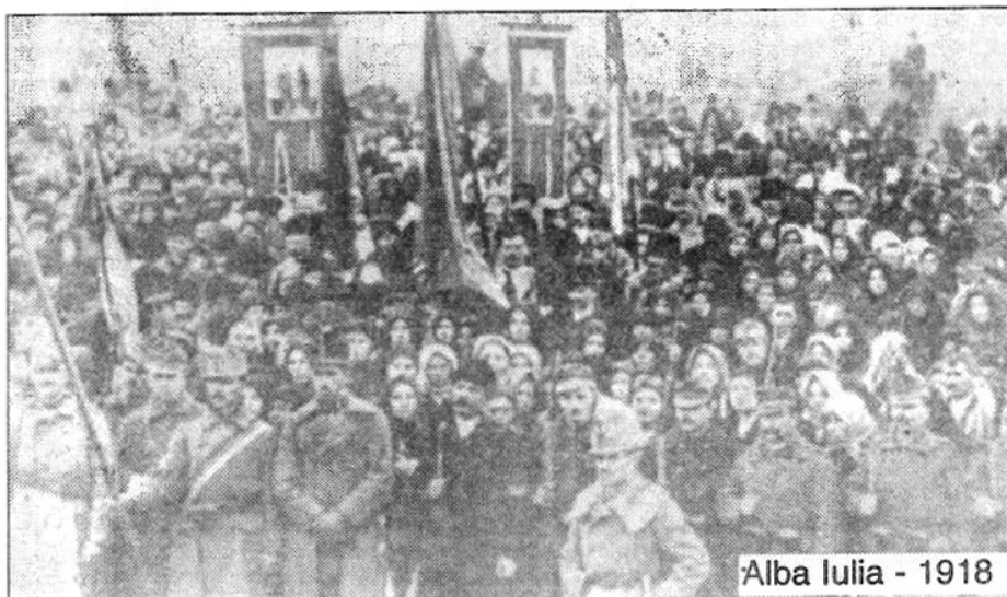
Alba Iulia - 1918