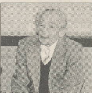
Scriitorul Vlaicu Bârna