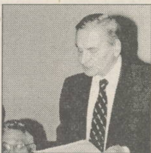
Prof. univ. Radu Beligan