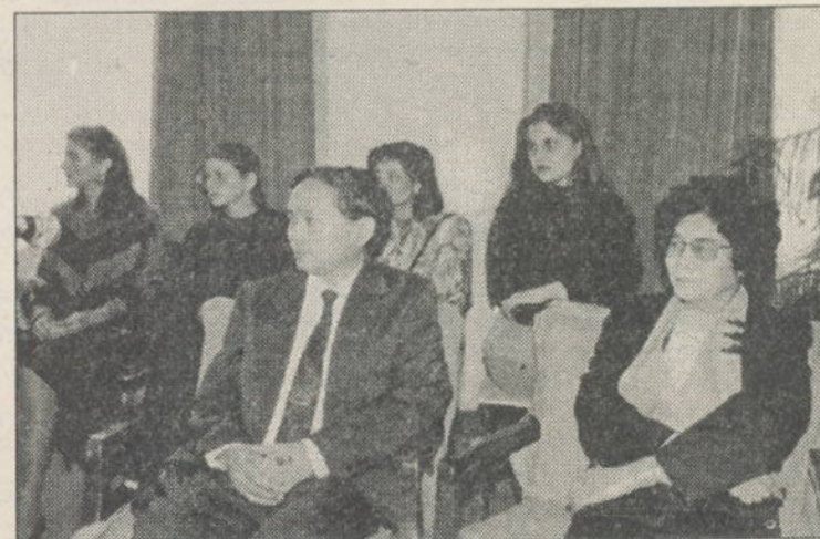
Aspecte de la desfășurarea Simpozionului Liviu Rebreanu, la sediul Academiei de Cultură Națională "Dimitrie Gusti", din Palatul Sporturilor și Culturii - București.

La Academia de Cultură Națională "Dimitrie Gusti" din cadrul Fundației "România de Mâine"