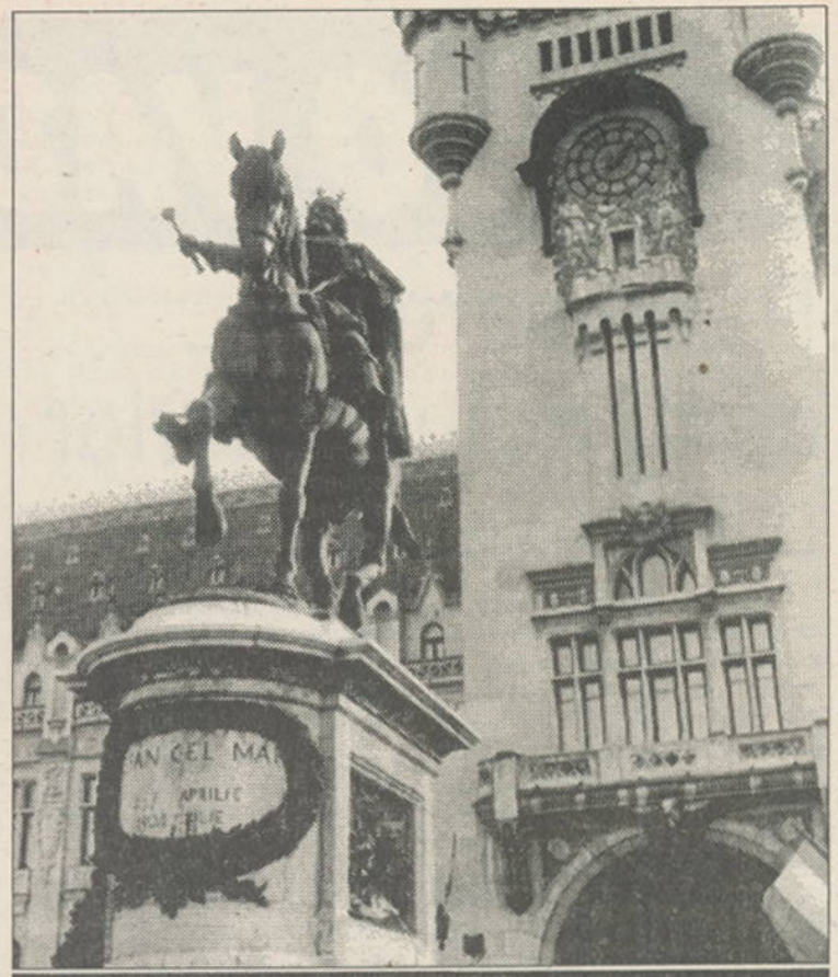
Monumentul lui Ștefan cel Mare (Iași)

Sunt destul de multe mărturiile care probează că, în realizarea planului său, Mihai Viteazul a avut în vedere și a folosit unitatea etnică a locuitorilor din Țara Românească, Transilvania și Moldova ca un factor esențial în unirea lor și în crearea, prin strângerea lor într-un organism politic, a spațiului de securitate românească. Deși de scurtă durată, lipsindu-i fundamentul social, Unirea Țărilor Române sub Mihai Viteazul a răscolit adânc conștiința românească și a lăsat urme durabile; ea a devenit, peste vreme, torța spre lumina căreia s-au îndreptat toate generațiile din etapele ulterioare ale luptei pentru Unire.