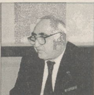
Scriitorul Dinu Săraru