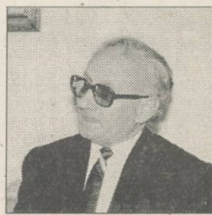
Prof.univ. Virgil Constantinescu

Fotografiile de la Simpozion sunt realizate de