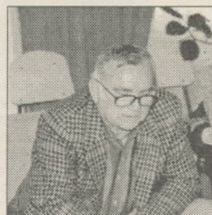
Scriitorul D.R. Popescu