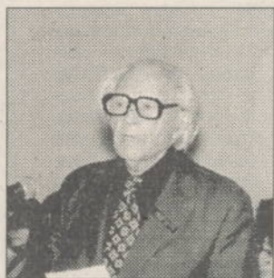
Acad. Romulus Vulcănescu