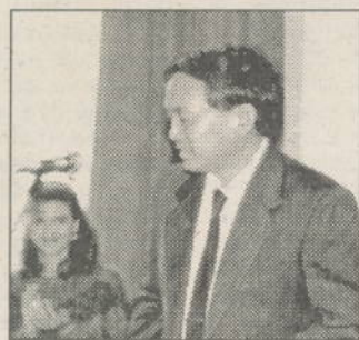
Scriitorul Zhu Kewen