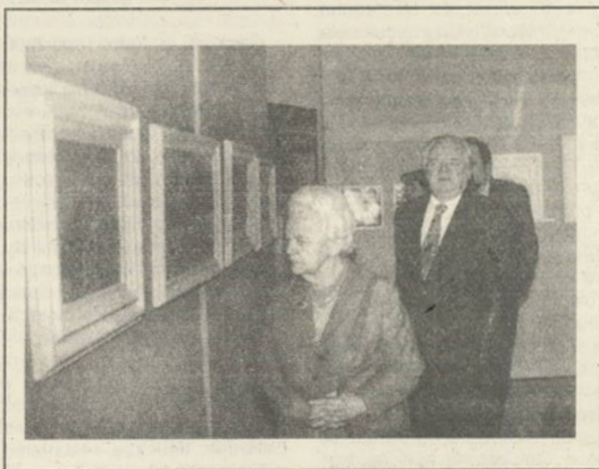
Deschisă la Casa Americii Latine din București.