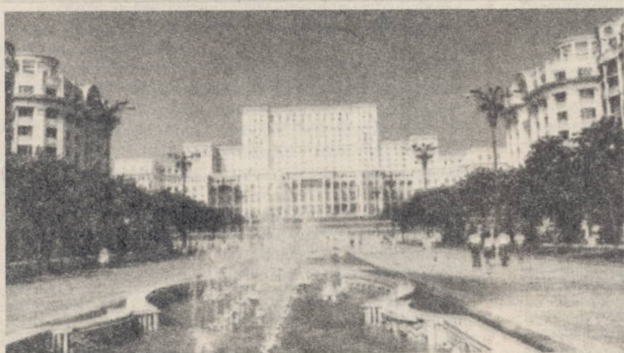
Imagini ale impunătorului edificiu "Palatul Parlamentului" din București, elogios apreciat de participanții la Forumul Crans-Montana.

Dacă România dorește investiții de capital străin este absolut necesar ca politica sa fiscală și de garanții să nu fie numai favorabilă, ci mult mai favorabilă decât a țărilor dezvoltate sau a celor din estul Europei. Prin politica fiscală, România poate da un nou sens la