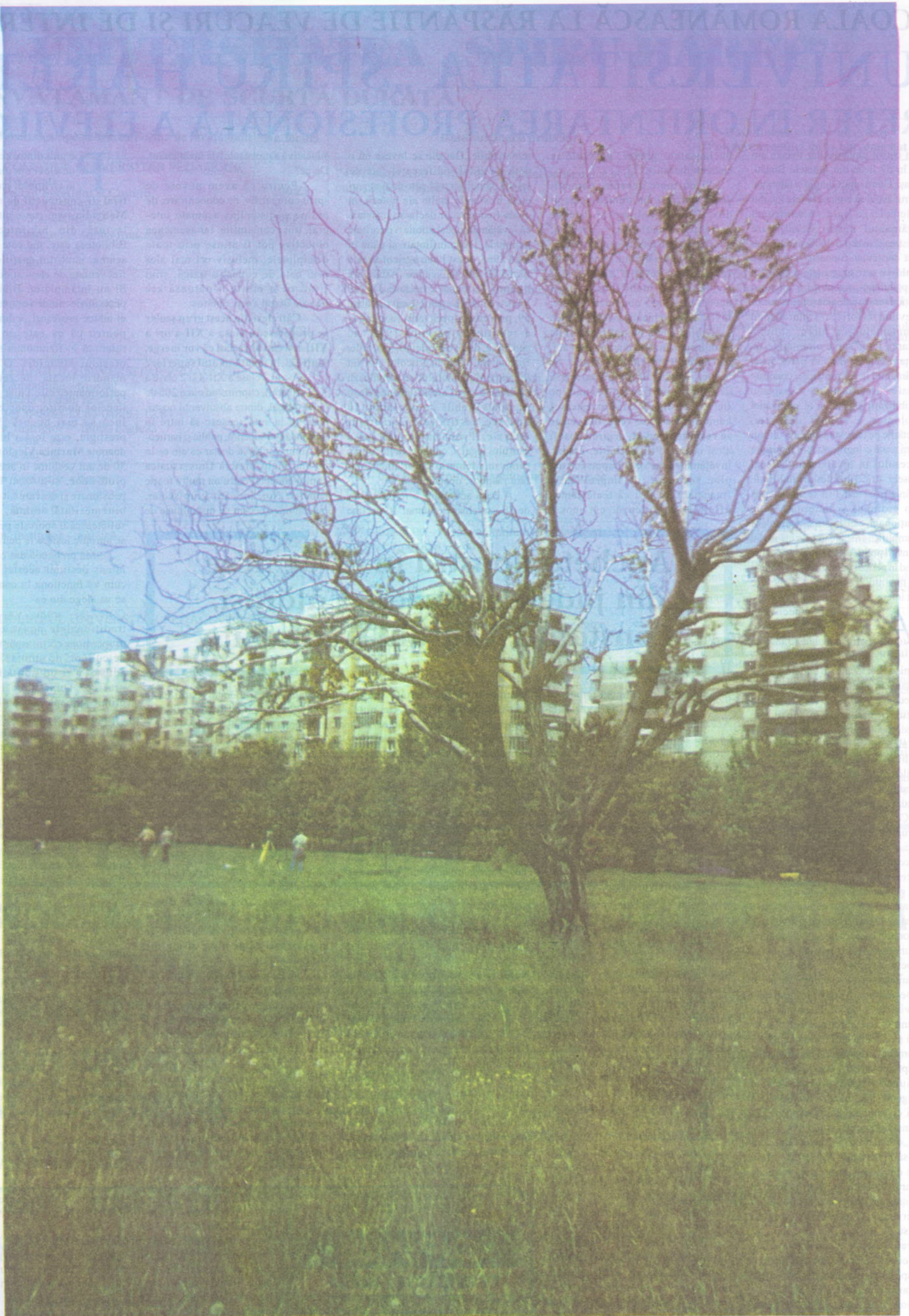
Imagine a terenului și nucului la care se referă senatorul Corneliu Turianu, în interpelarea rostită în Senatul României, luni, 14 iunie 1999.

(Interpelare publicată în pagina 1 a acestui număr al revistei noastre)