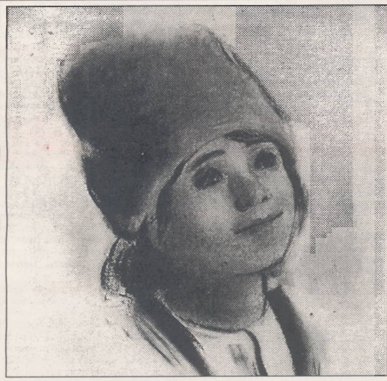
Ion Creangă, copil. Desen de JIQUIDI