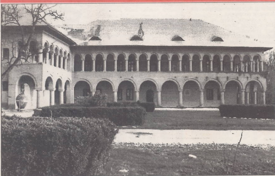
Centrul Cultural Național Mogoșoaia

*Vezi și Echilibrul puterilor în stat și contingentele lor în Constituția din 1991 . („Opinia națională” nr. 131-132)