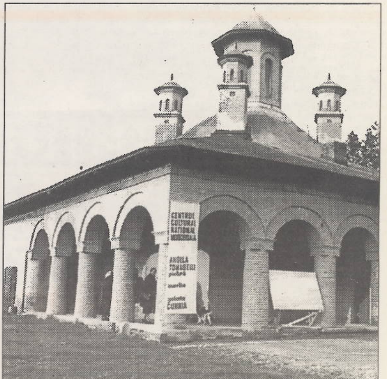
Centrul Cultural Național Mogoșoaia

Trebuie subliniat faptul că, în prezent, în numeroase state ale lumii este consacrat principiul controlului constituționalității legilor și a hotărârilor puterii executive și acestea sunt de atributul unor autorități denumite Curți, Consilii sau Tribunale Constituționale.