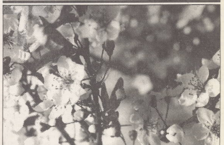
În întâmpinarea îndelung așteptatei primăveri, un gând bun și sentimente alese tuturor celor pentru care tradiția noastră a creat Sărbătoarea Mărțișorului

Ordinea socială este un concept care are un caracter istoric și arată etapele dezvoltării statului. Sunt opinii care văd în ordinea socială organizarea societății într-o anumită etapă. Identitate, dacă nu confuzie, se face adesea și între ordinea de drept și ordinea publică . Cum ordinea publică se referă la respectarea unor norme de comportare, la libertatea de circulație și a întrunirilor, la liniștea publică etc., nu există o