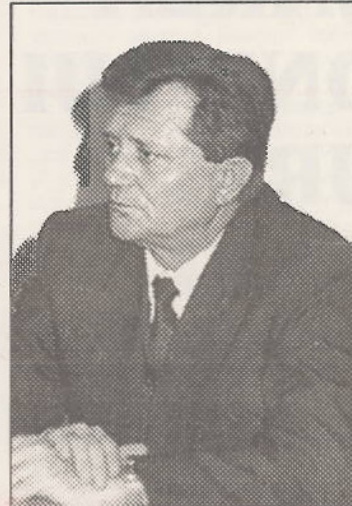
Cuvântul inaugural rostit de secretarul de stat în Ministerul de Interne, GHICJU PAȘCU

Stimați invitați, doamnelor și domnilor,