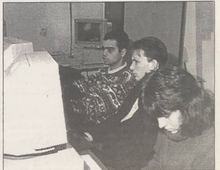
La Universitatea „Spiru Haret”

parat. Confruntarea sistemelor naționale permite identificarea unor constante de reglementare, definirea unui corp de principii, instituții juridice sau chiar reglementări, pe care semnul generalității le consacră ca făcând parte din patrimoniul de concepte juridice general-umane. Ele exprimă, incontestabil, platforma minimală - dar universală - a concepției umane despre bine și rău, despre just sau injust. Dacă aceste constante sunt o ilustrare a dreptului natural, izvorâte din natura umană sau au cauze sociale, este o problemă prea amplă și prea discutată în filosofia dreptului - care, de altfel, nu a reușit nici astăzi să găsească o explicație care să fie admisă de toți - pentru a stăruia asupra ei.