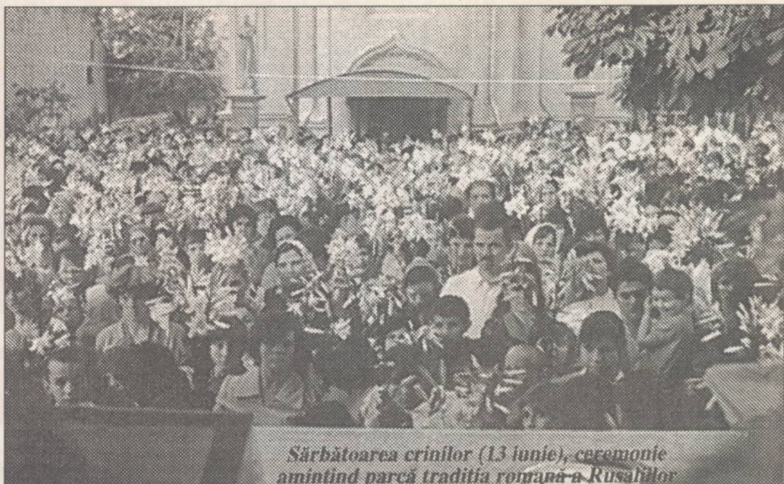
Sărbătoarea crinilor (13 iunie), ceremonie amintind parcă tradiția română a Rusărilor

maghiari, prin biserică și școală nu au dat rezultate; limba română n-a putut fi izgonită, ea este limba maternă a așa-zisilor ceangăi.