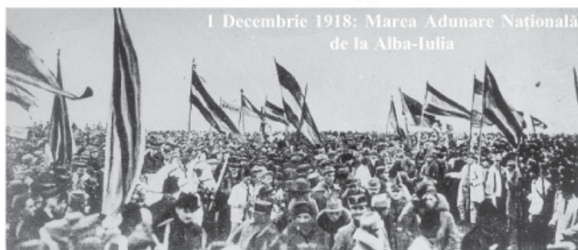
1 Decembrie 1918: Marea Adunare Națională de la Alba-Iulia