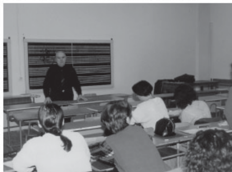
Oră de curs la Facultatea de Muzică a Universității „Spiru Haret”

Repet, acestea sunt doar câteva din modalitățile care, după părerea mea, ar asigura desfășurarea cât mai echitabilă a acestui complex proces de retrocedare.