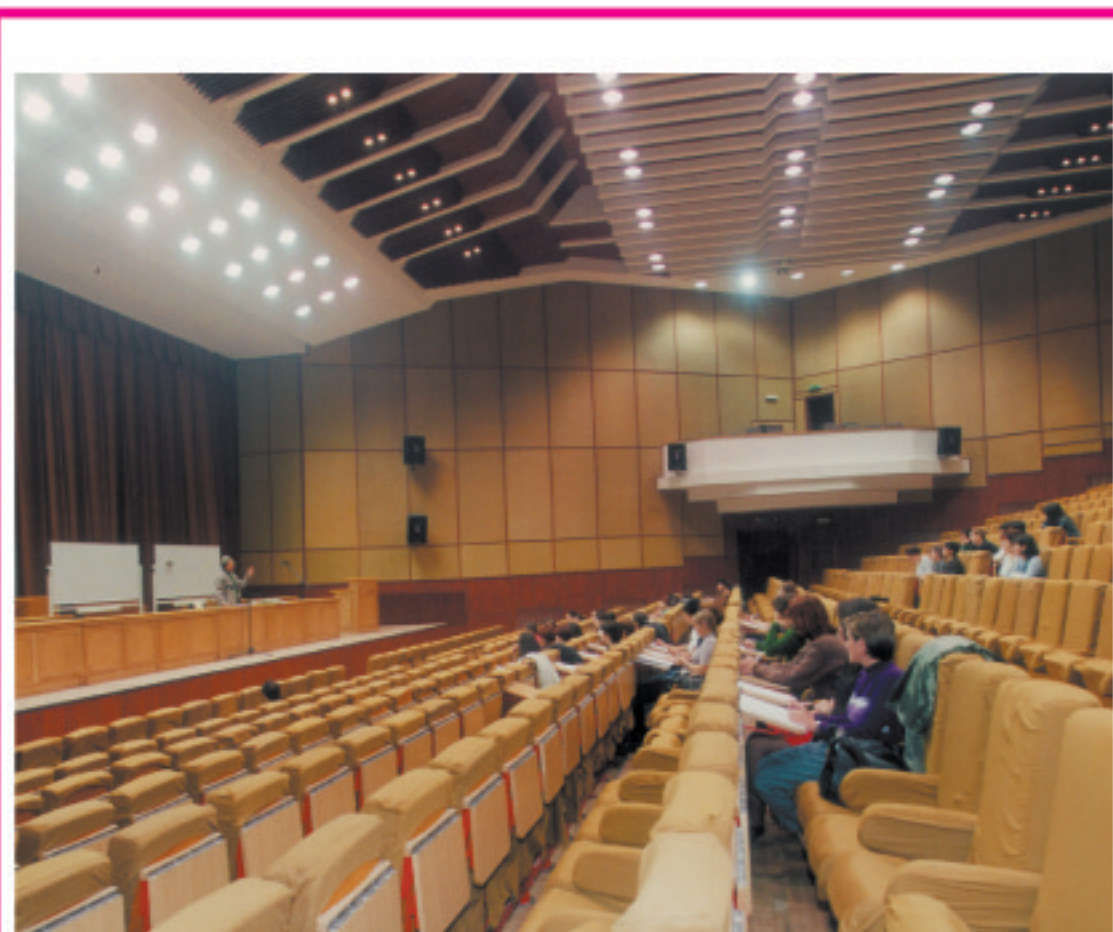
Amfiteatrul Mare al Universității „Spiru Haret”

Fără îndoială că dezvoltarea rurală constituie un obiectiv de lungă durată, el nu poate fi realizat fără un program adecvat de intervenții și, mai ales, fără participarea directă și responsabilă a administrației publice locale, care, după opinia noastră, are nevoie, la rândul ei, de o restructurare și adaptare corespunzătoare realelor cerințe și îndatoriri pentru spațiul rural românesc.