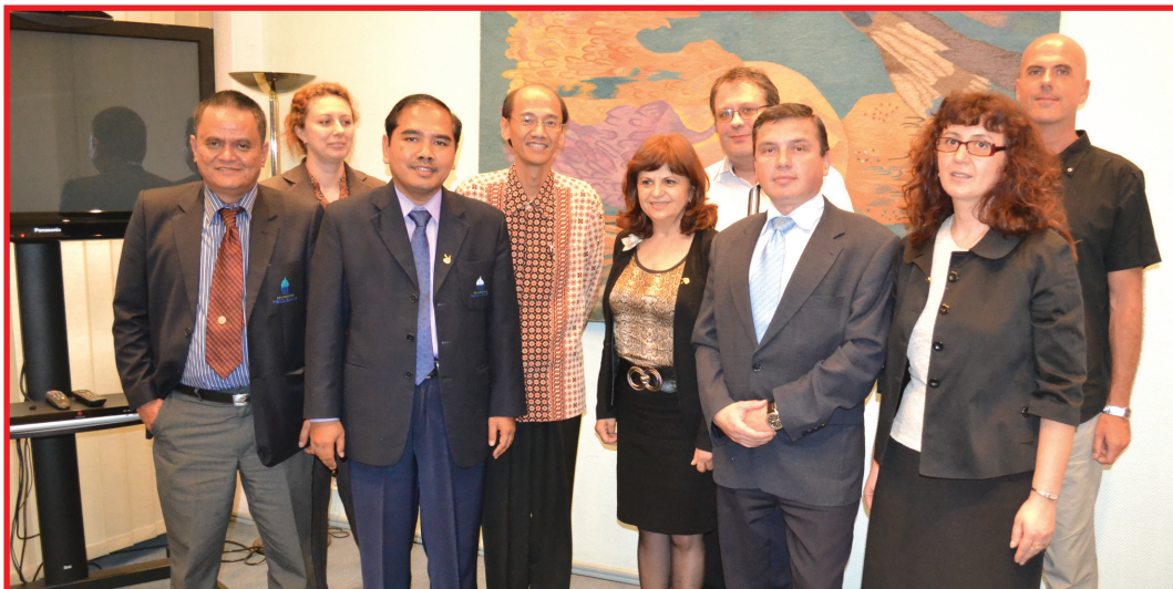
Vineri, 14 iunie, Universitatea Spiru Haret a încheiat un Momerandum de cooperare cu Mercu Buana University din Indonezia

Anul 21, nr. 624, 17 iunie 2013, 8 pagini, 1 leu, www.opinianaționala.ro