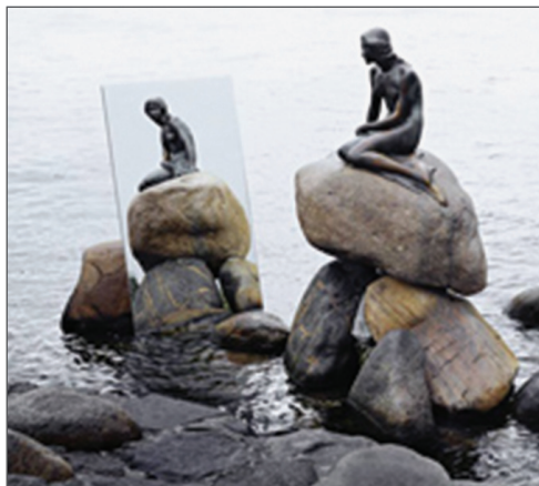
fig. 4. Elmgreen & Dragset, When a Country Falls in Love with Itself , 2008, oglinză

a cuplului artistic Elmgreen & Dragset ne face să ne gândim și să reflectăm la autosuficiență, dar și la permanenta raportare la un trecut apus. Cu siguranță că nu doar artiștii români se plâng de stagnarea în tradițiile pășuniste, ci și nordicii.