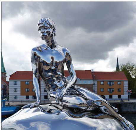
fig. 3. Elmgreen & Dragset, Han , 2012, oțel, geam securizat, granit, aluminiu, (c) Elmgreen & Dragset, Helsingør, Danemarca

Ultima decapitare a avut loc în 2012. Prin această sculptură, devenită simbol național, danezii își exprimă și dragostea absolută pentru autorul lor favorit, Hans Christian Andersen. În 2008, Elmgreen & Dragset au avut o intervenție temporară, sub forma unei oglinzi, lângă mica sculptură (fig. 4) intitulată When a Country Falls in Love with Itself ( Când o țară se îndrăgostește de ea însăși ). Intervenția subtilă